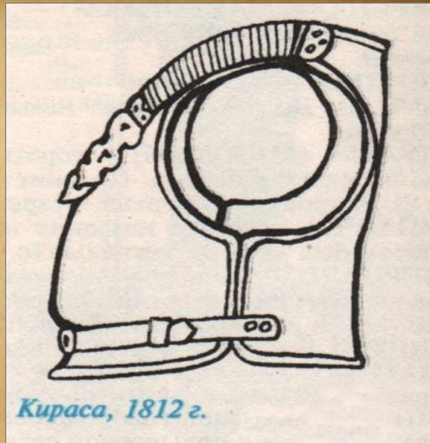
Кираса, 1812 г.

В начале 1812 г. русским кирасирам были возвращены нагрудные латы. Кираса образца 1812 г. изготовлялась из железа, сверху покрывалась черной краской и состояла из двух половин: нагрудной и спинной. Они скреплялись при помощи двух ремней