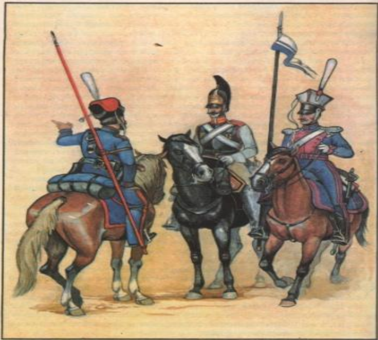
Кавказ. Войска Донского, рядовой Кавалергардского полка, рядовой Литовского уланского полка. 1812 г.