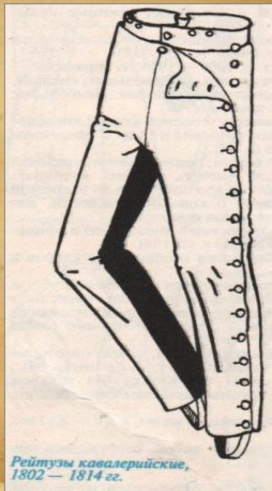
Рейтузы кавалерийские, 1802 — 1814 гг.

В парадном строю кирасиры, как и прежде, носили белые суконные панталоны с ботфортами, в походе — серые рейтузы на боковых пуговицах.