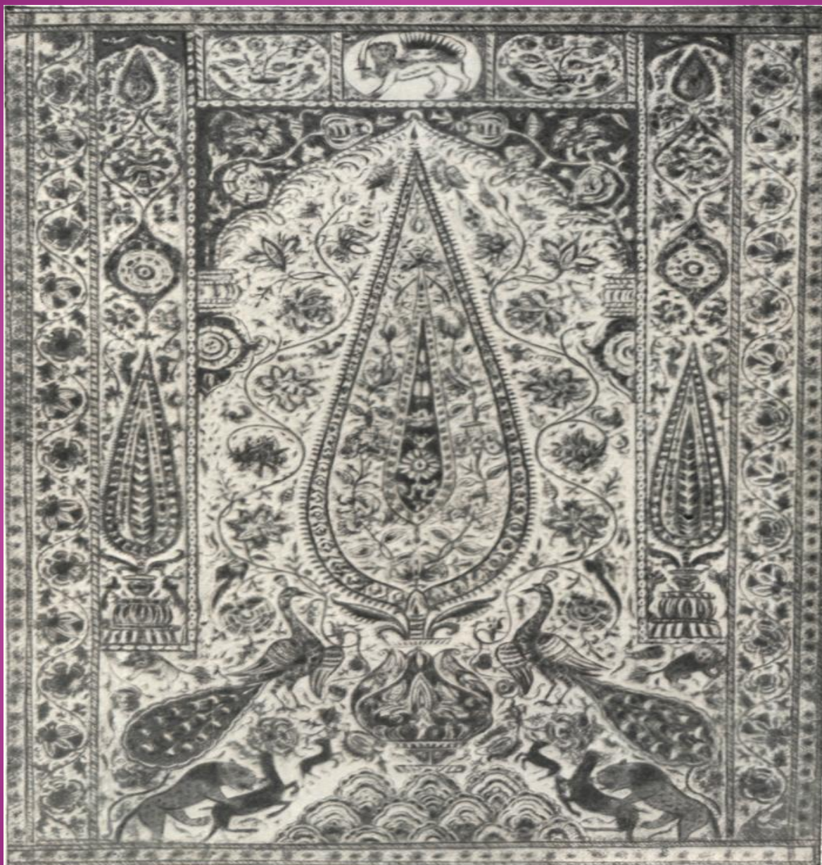
ИРАНСКИЙ КОВЕР. XVIII в.