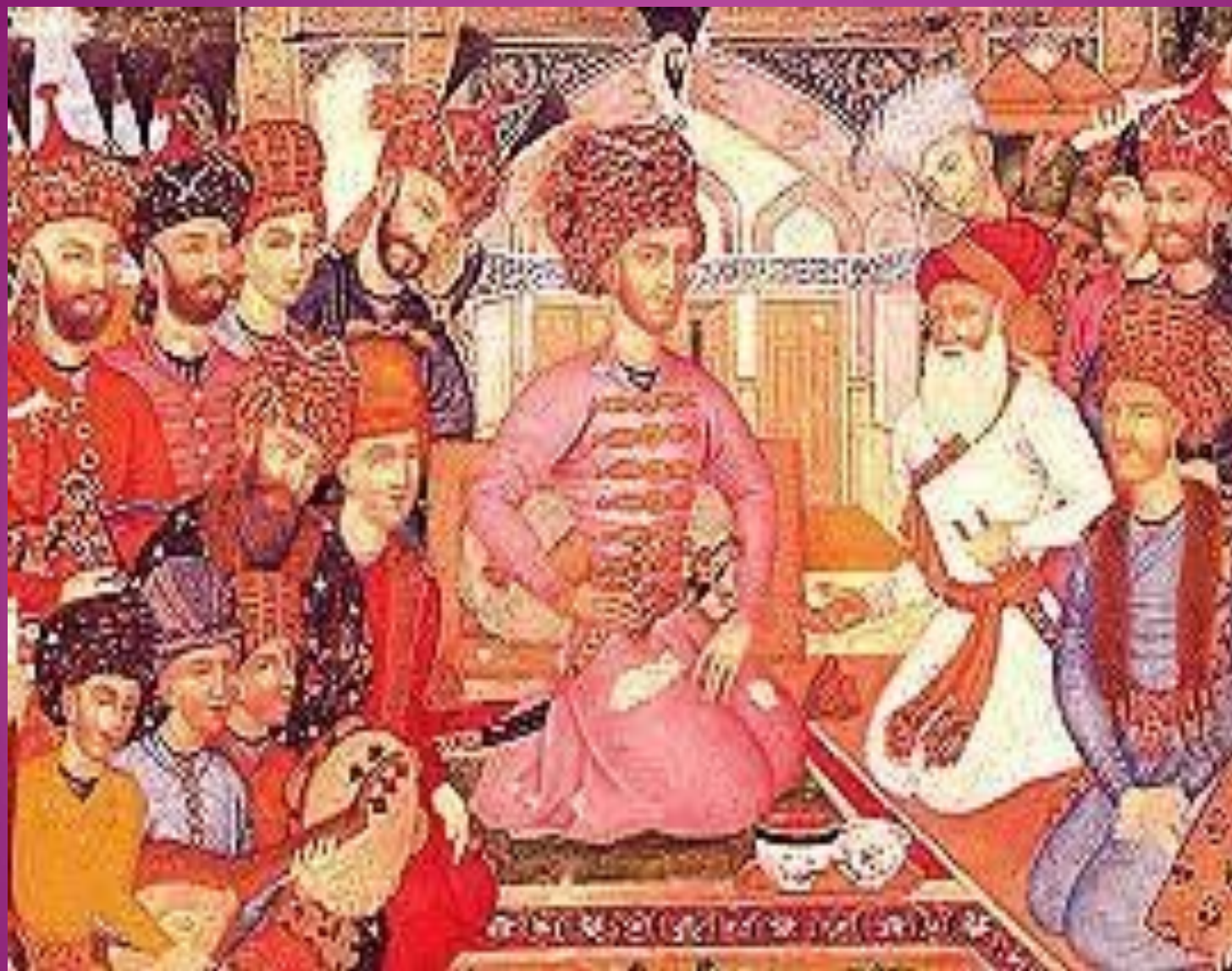
Надир-шах и придворные