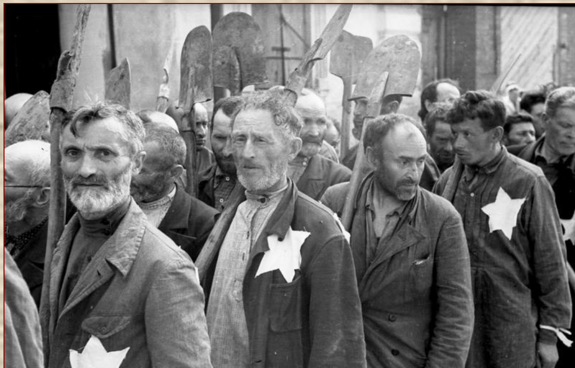
Juli 1941

Жёлтая звезда Давида — особый отличительный знак, который по приказу нацистов должны были носить евреи на подконтрольной властям Германии территории в период Холокоста. Служили для того чтобы отличать евреев в общественных местах