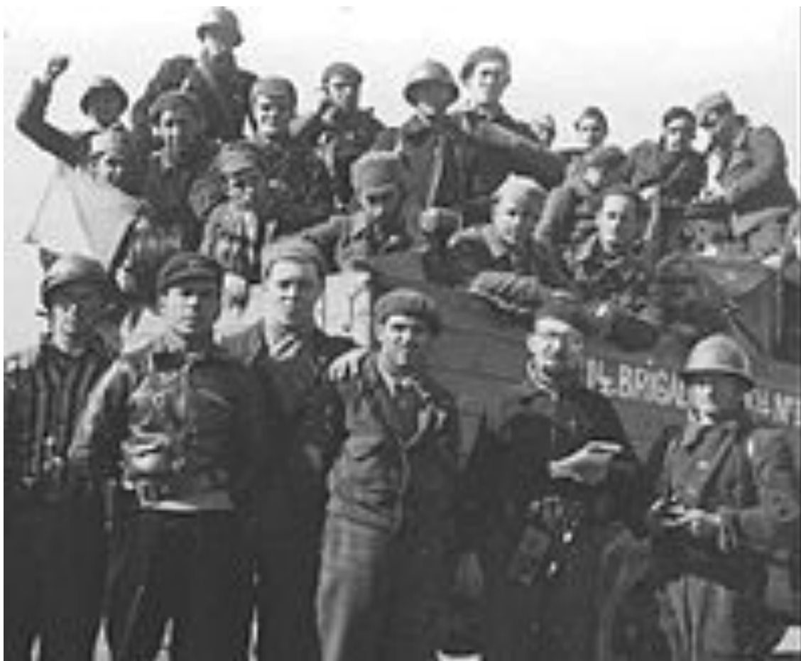
Бойцы 14-й интернациональной бригады Народной армии