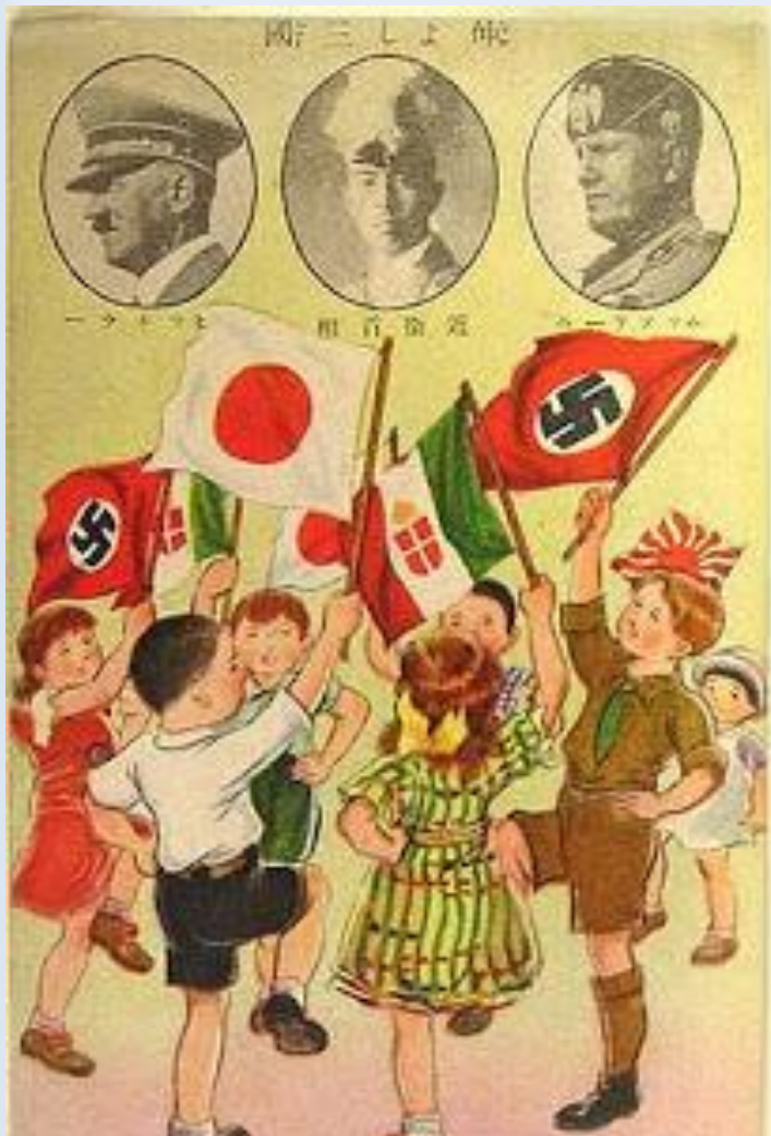
Японский плакат, посвященный подписанию Тройственного пакта

Три державы агрессора, заключили военно- политические договорённости