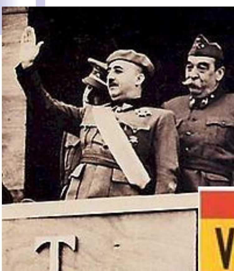
Франсиско Франко (в центре)