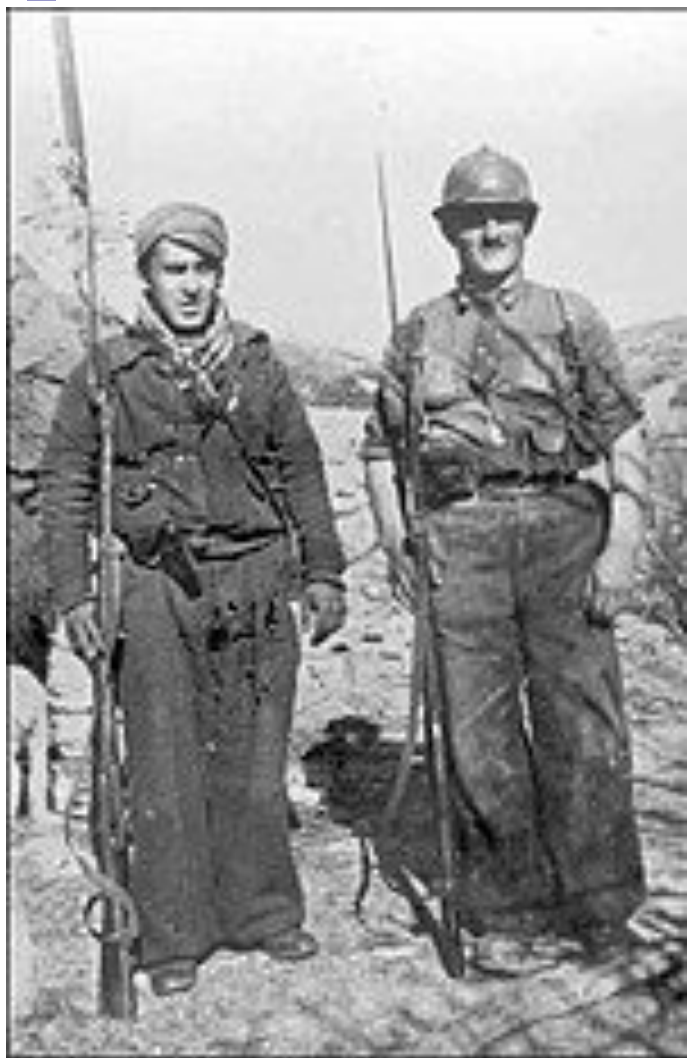
Бойцы республиканской армии. 1937