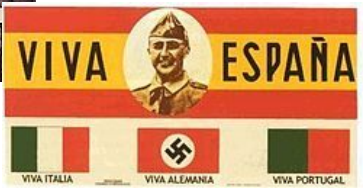
Плакат испанских националистов: «Да здравствуют Испания, Италия, Германия и Португалия!» (в центре портрет Франко)