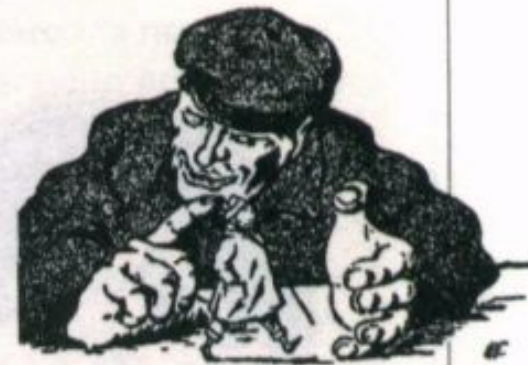
«До времени пусть погуляет». Карикатура на нэпмана из журнала «Крокодил». 1923 г.

Внедрялись в нэповскую экономику и элементы долгосрочного планирования . Первый такой план был подготовлен Государственной комиссией по электрификации России (ГОЭЛРО) и одобрен еще на VIII съезде Советов в декабре 1920 г. В феврале 1921 г. была учреждена Государственная плановая комиссия (Госплан).