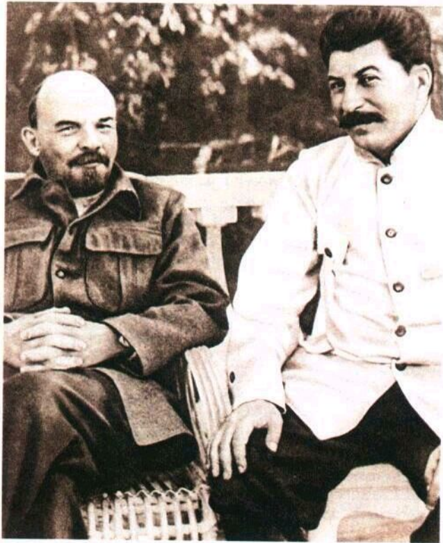
В. Ленин и И. Сталин фото, 1922 г.

Первый камень в фундамент культа личности И. В. Сталина закладывался в ходе внутривнутрипартийных дискуссий 20-х годов под лозунгом выбора верного, ленинского пути строительства социализма и установления идеологического единства.