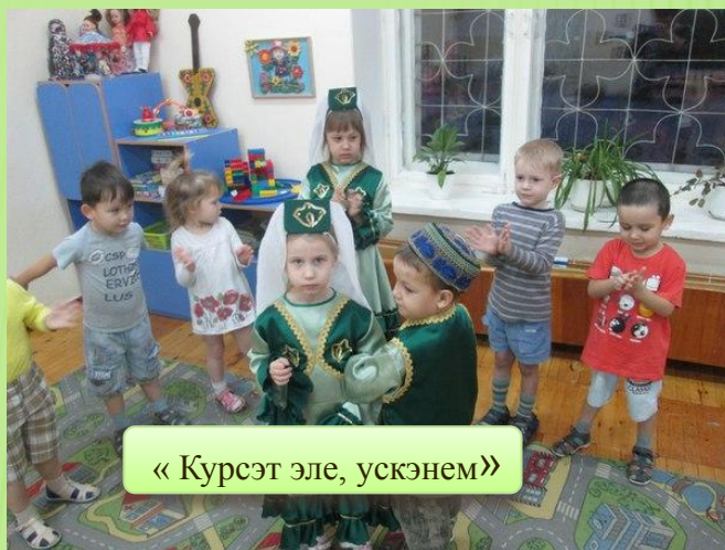
«Курсэт эле, ускэнем»

Игра является эффективной и доступной формой деятельности при обучении русских детей татарской устной речи. Дети даже не задумываются, что они учатся, сами того не замечая, намного лучше усваивают татарские слова, фразы, предложения и на этой основе у них отрабатывается правильное произношение специфических татарских звуков.