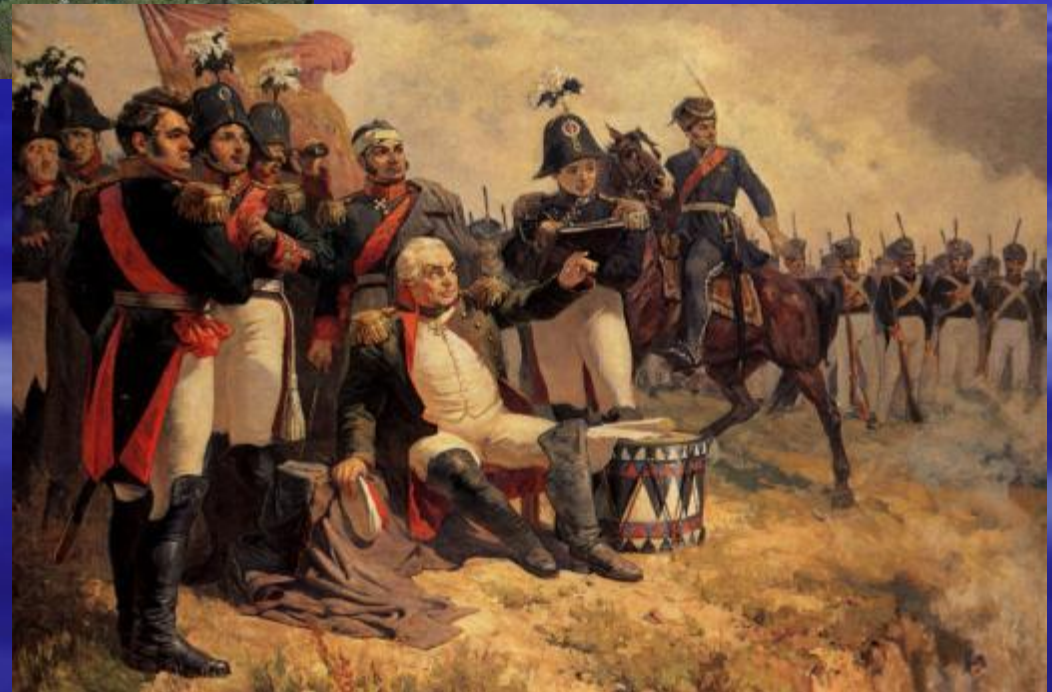
М. И. Кутузов на командном пункте в день Бородинского сражения