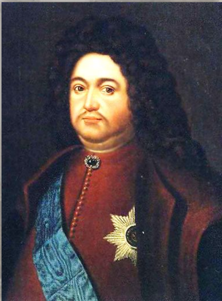
БОЯРИН ТИХОН НИКИТИЧ СТРЕШНЕВ

В состав Сената царь назначил 9 человек боярской знати и своих выдвигенцев. Решения принимались коллегиально. Он превратился в постоянно действующее высшее правительственное учреждение, что было закреплено Указом 1722 года :