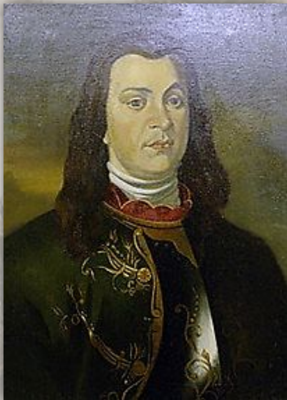
АНТОН МАНУИЛОВИЧ ДЕВИЕР –

первый генерал- полицмейстер Санкт-Петербурга