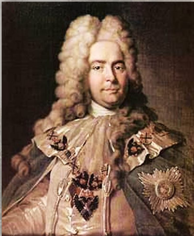
ПАВЕЛ ИВАНОВИЧ ЯГУЖИНСКИЙ

Одновременно с Сенатом появилась должность фискалов . Обязанность обер-фискала при Сенате и фискалов в провинциях состояла в негласном надзоре за деятельностью учреждений: выявляли случаи нарушения указов и злоупотреблений и доносили Сенату и царю. С 1722 года контроль над Сенатом осуществляют генерал-прокурор и обер-прокурор, которым подчинялись прокуроры