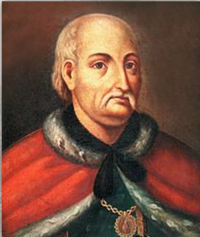
ИВАН ИЛЬИЧ СКОРОПАДСКИЙ

Особый режим местного самоуправления существовал на Украине: