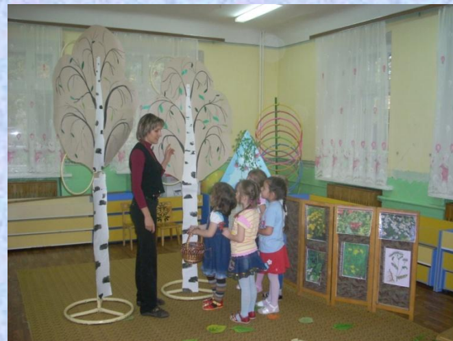
смотр открытых занятий на методических объединениях района