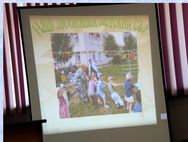
обучение на курсах ИКТ