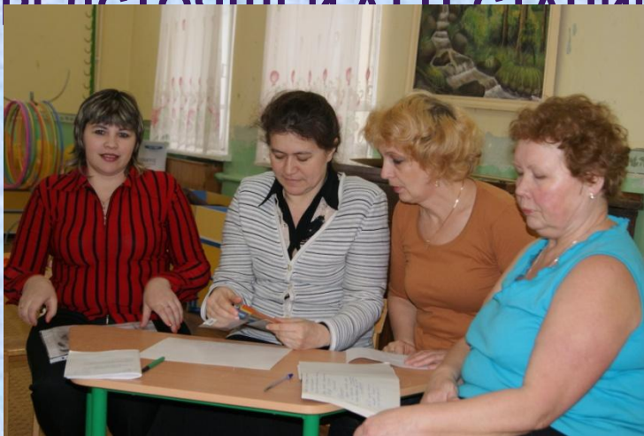
ознакомление с планом работы по аттестации