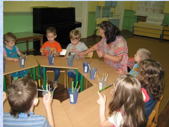
обобщение опыта работы на городском и республиканском уровне