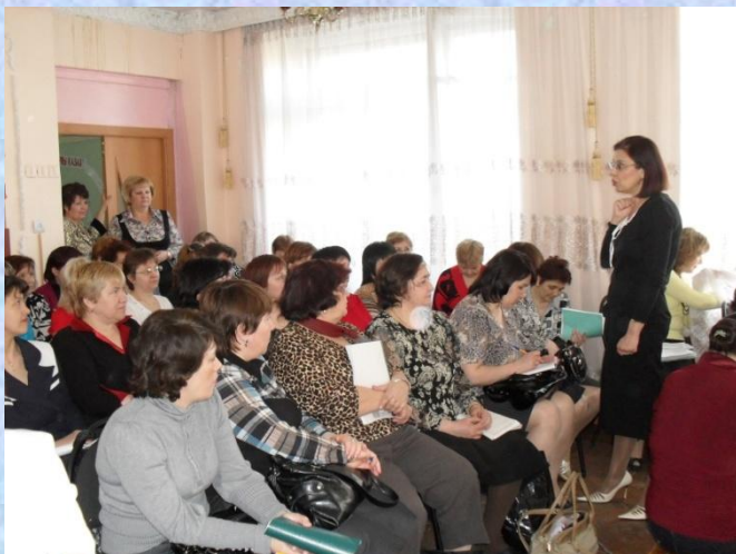
смотр мастер- класса для педагогов ДОУ в рамках курсов ИКТ