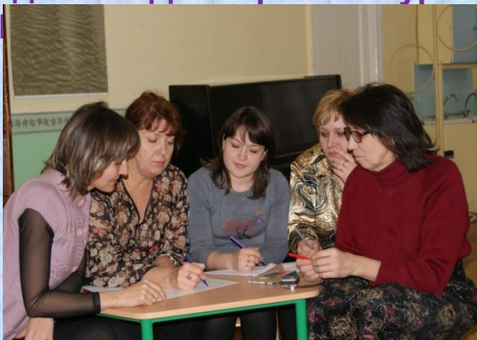
подготовка к компьютерному тестированию педагогов