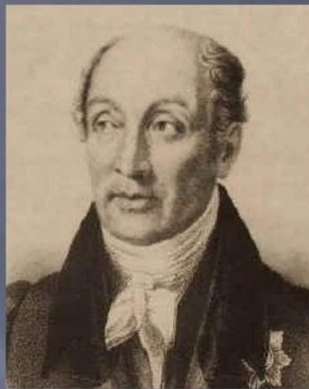
М. М. Сперанский.

В эпоху «Великих реформ» Александра II в России были созданы новые выборные сословно-представительные учреждения - земские собрания в уездах и губерниях. В этих учреждениях стали зарождаться ростки парламентаризма, и именно из этих земств, созданных во второй половине XIX века, вышел целый ряд деятелей, ставших уже в XX веке депутатами Государственной Думы.