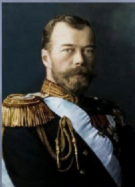
Император Николай II