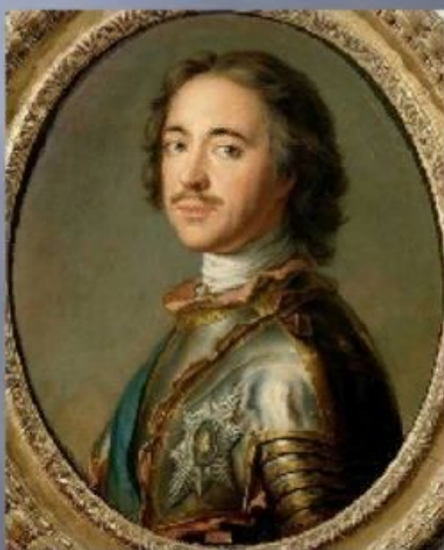
Петр I «Император и Самодержавец Всероссийский»

В XVI – XVIII веках в странах Западной Европы сословно представительные учреждения превратились в общенациональные выборные парламенты. В России развитие ее государственности пошло по другому пути, который предусматривал сосредоточение всех властных полномочий в стране в руках самодержавного монарха.