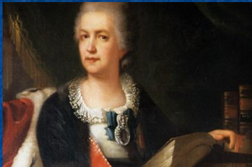
Екатерина Романовна Дашкова

29 ноября 1783 года в доме директора Петербургской академии наук княгини Екатерины Романовны Дашковой состоялось одно из первых заседаний недавно созданной Академии словесности.