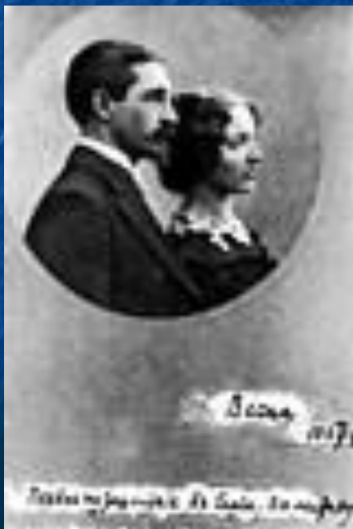
И.А. Бунин, В.Н. Бунина. Надпись Бунина: "Весна 1907 г. Первое путешествие в Сирию, Палестину." 1907 год.

В 1907 Бунины отправились в путешествие по странам Востока - Сирии, Египту, Палестине. Не только яркие, красочные впечатления от путешествия, но и ощущение нового наступившего витка истории дали творчеству Бунина новый, свежий импульс.