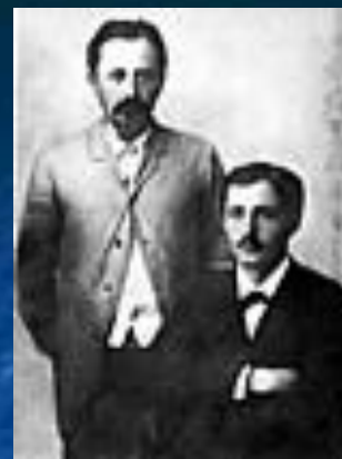
Ю.А. и И.А. Бунины. Полтава. 1891 г.

Детство будущего писателя протекало в условиях дворянской скудеющей жизни, окончательно разорившегося "дворянского гнезда" (хутор Бутырки Елецкого уезда Орловской губернии). Он рано выучился читать, с детства обладал фантазией и был очень впечатлителен. Поступив в 1881 в гимназию в Ельце, проучился там всего пять лет, так как семья не имела на это средств, завершать гимназический курс пришлось дома (осваивать программу гимназии, а потом и университета ему помогал старший брат Юлий, с которым писателя связывали самые близкие отношения). Дворянин по рождению, Иван Бунин не получил даже гимназического образования, и это не могло не повлиять на его дальнейшую судьбу.