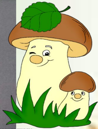
Играем до школы