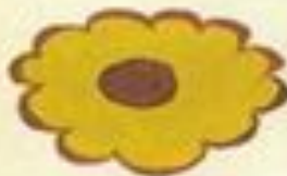
Flower No. 10