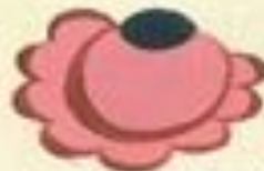
Flower No. 13a (pink) and 13b (red)—not shown