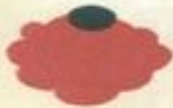
Flower No. 1