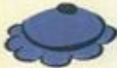
Flower No. 12