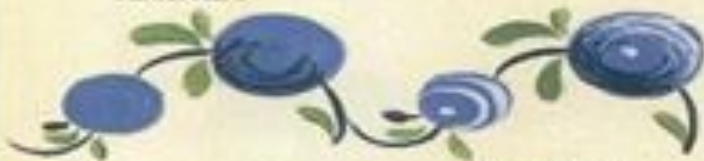
Flower No. 8