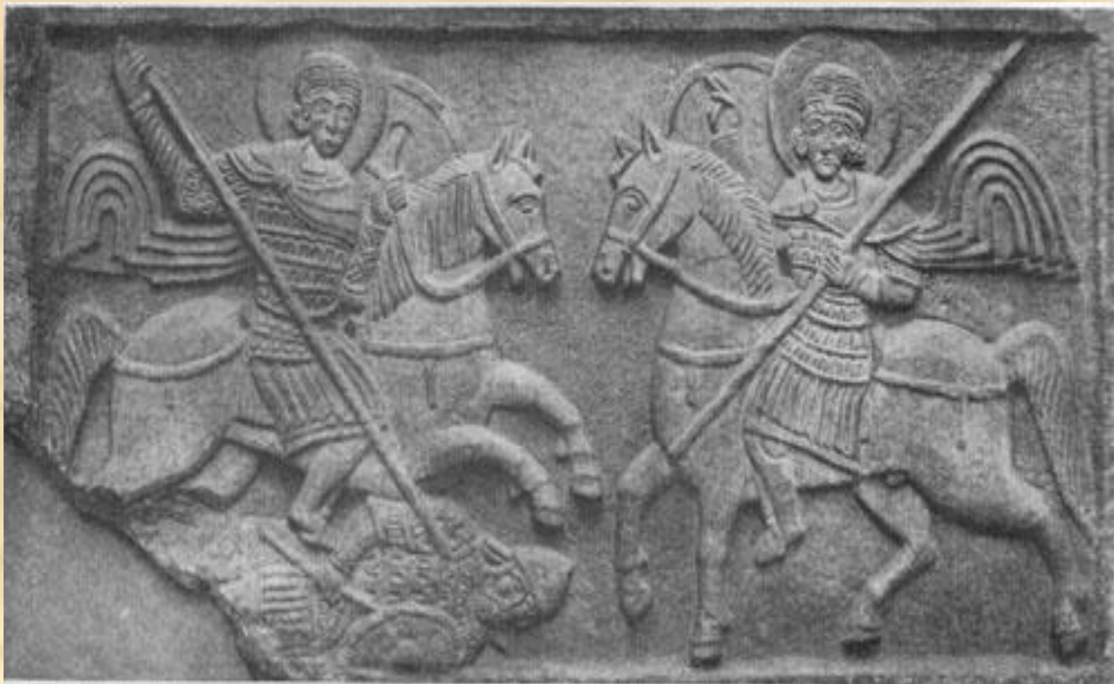
Рельеф Михайловского-Златоверхого монастыря в Киеве (XI в.)