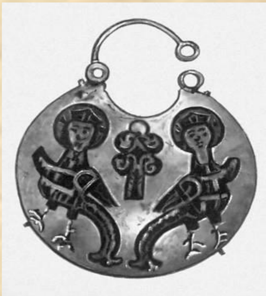
Золотой колт с перегородчатой эмалью. 11—12 вв. Исторический музей УССР. Киев.