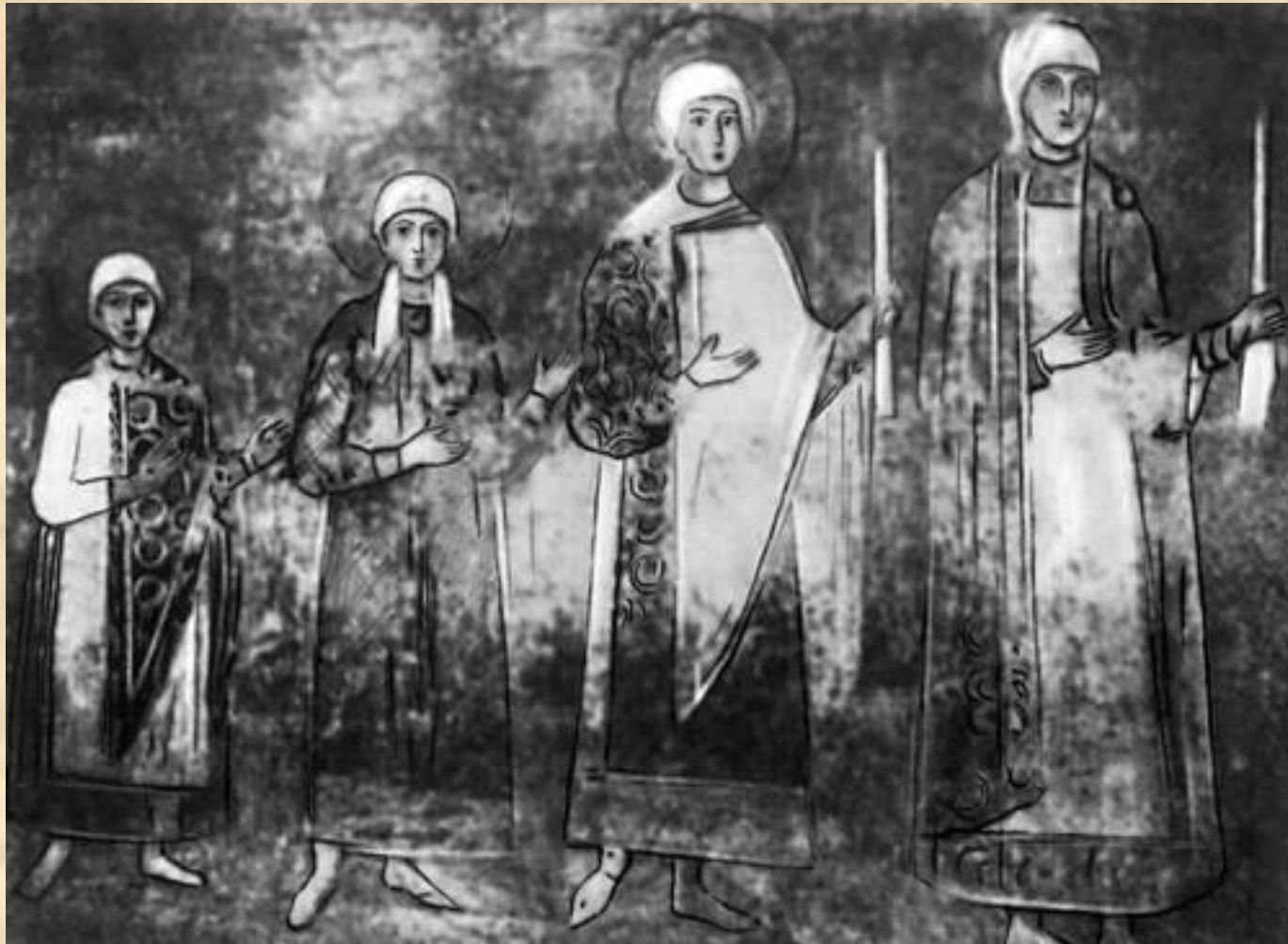
«Дочери Ярослава Мудрого». Фреска в центральном нефе Софийского собора в Киеве. Середина 11 в.