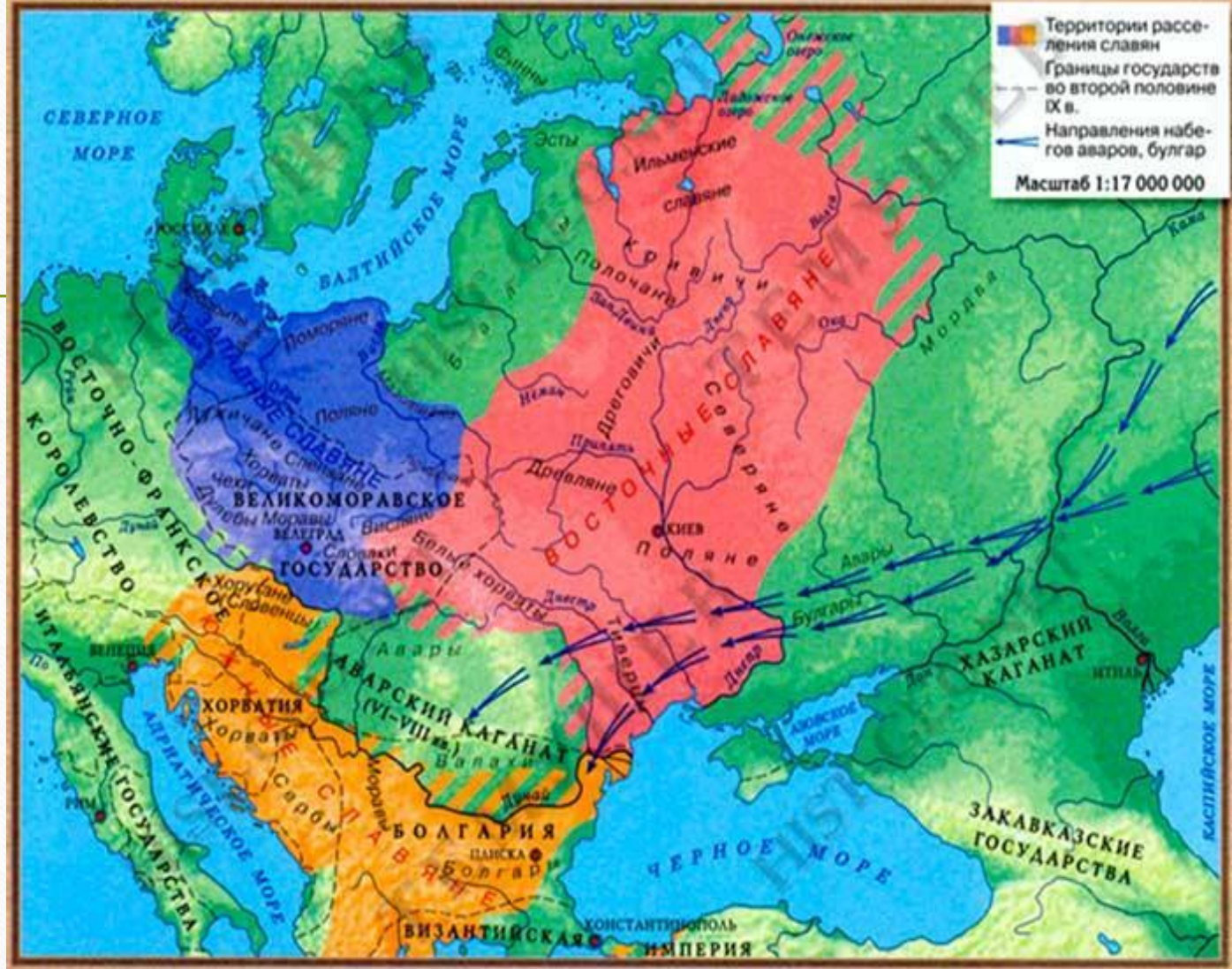
ЗАПАДНЫЕ, ЮЖНЫЕ И ВОСТОЧНЫЕ СЛАВЯНЕ