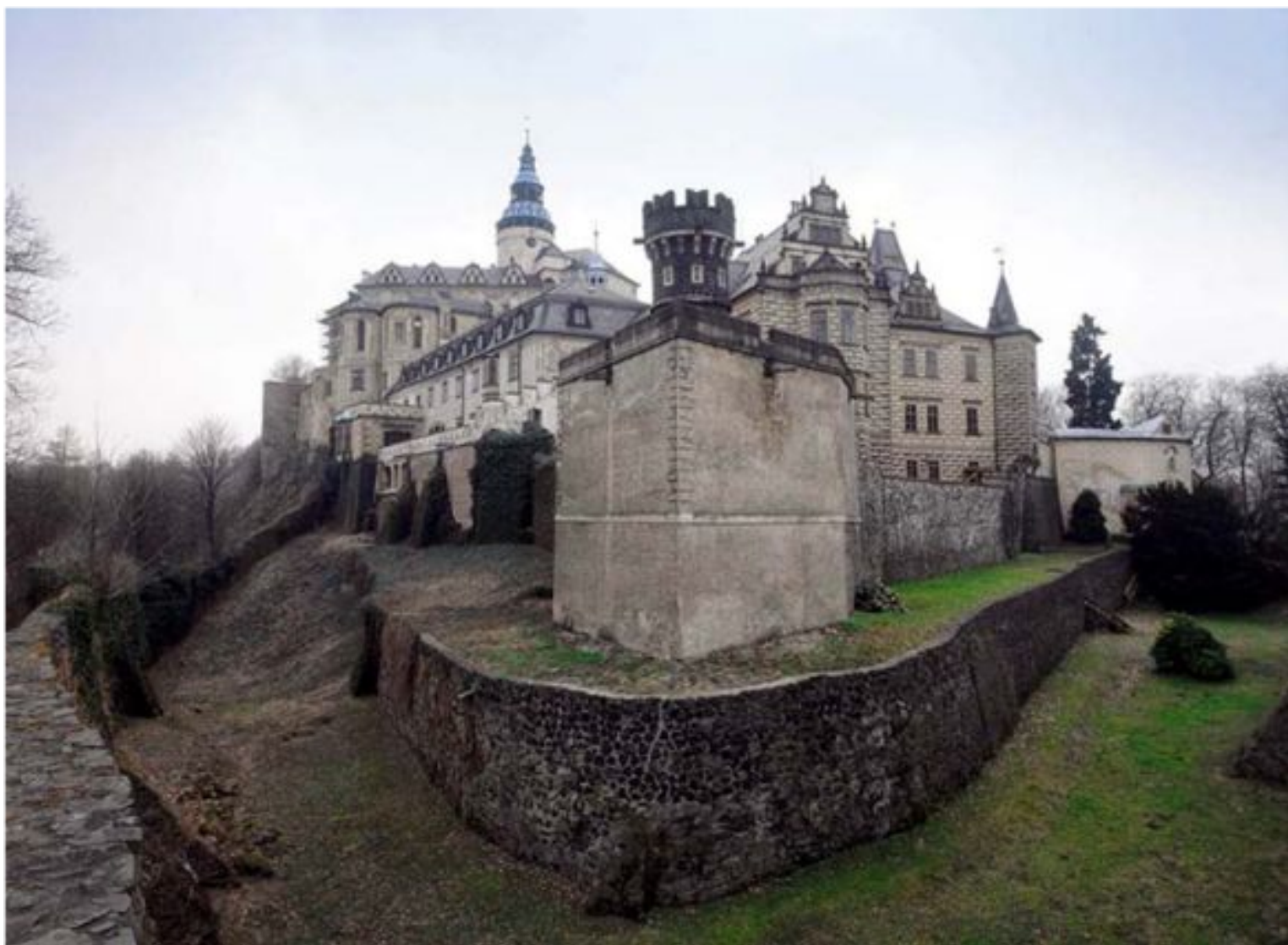
Замок Фридлант. Чехия