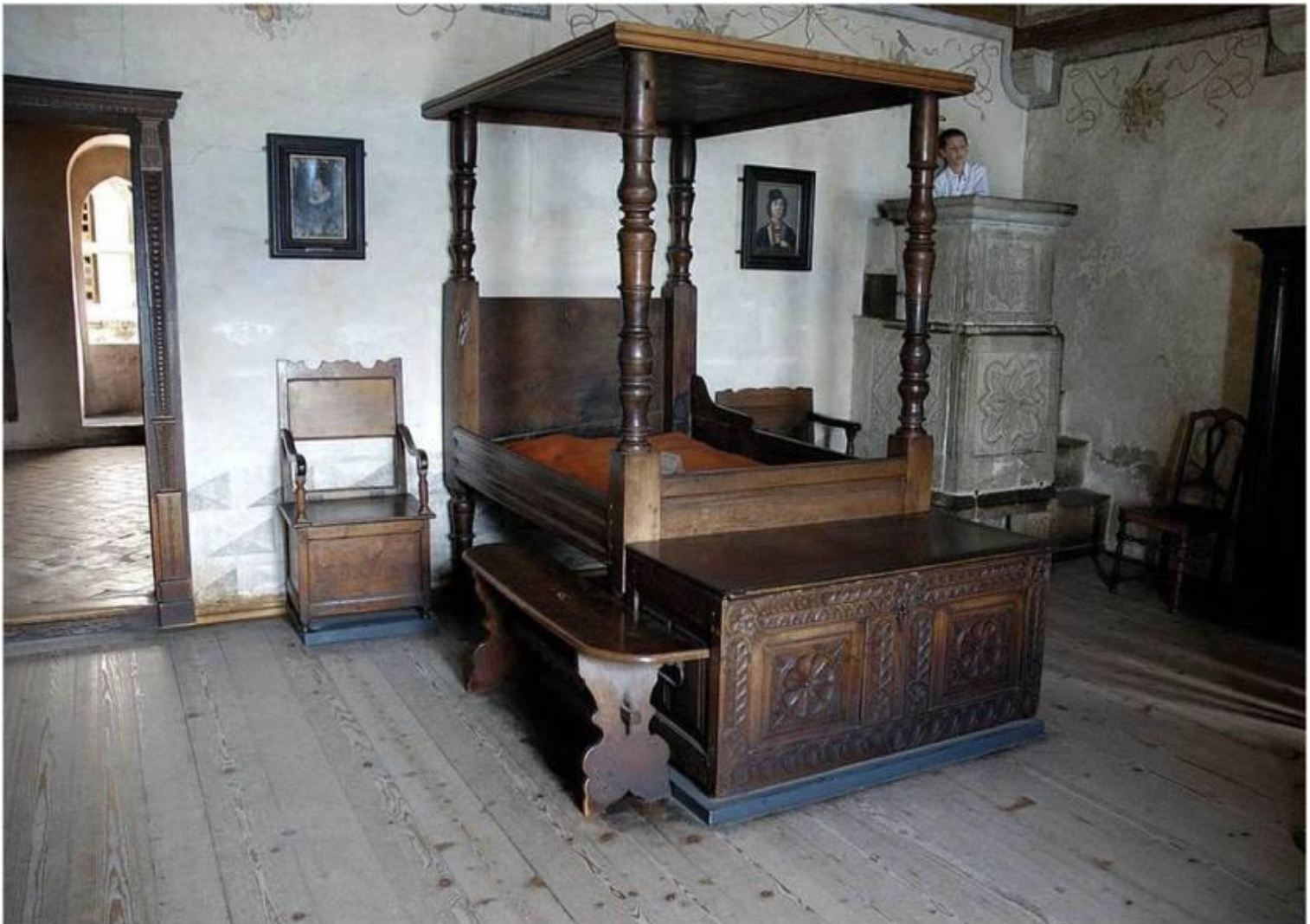
Спальня хозяев замка. Реконструкция.