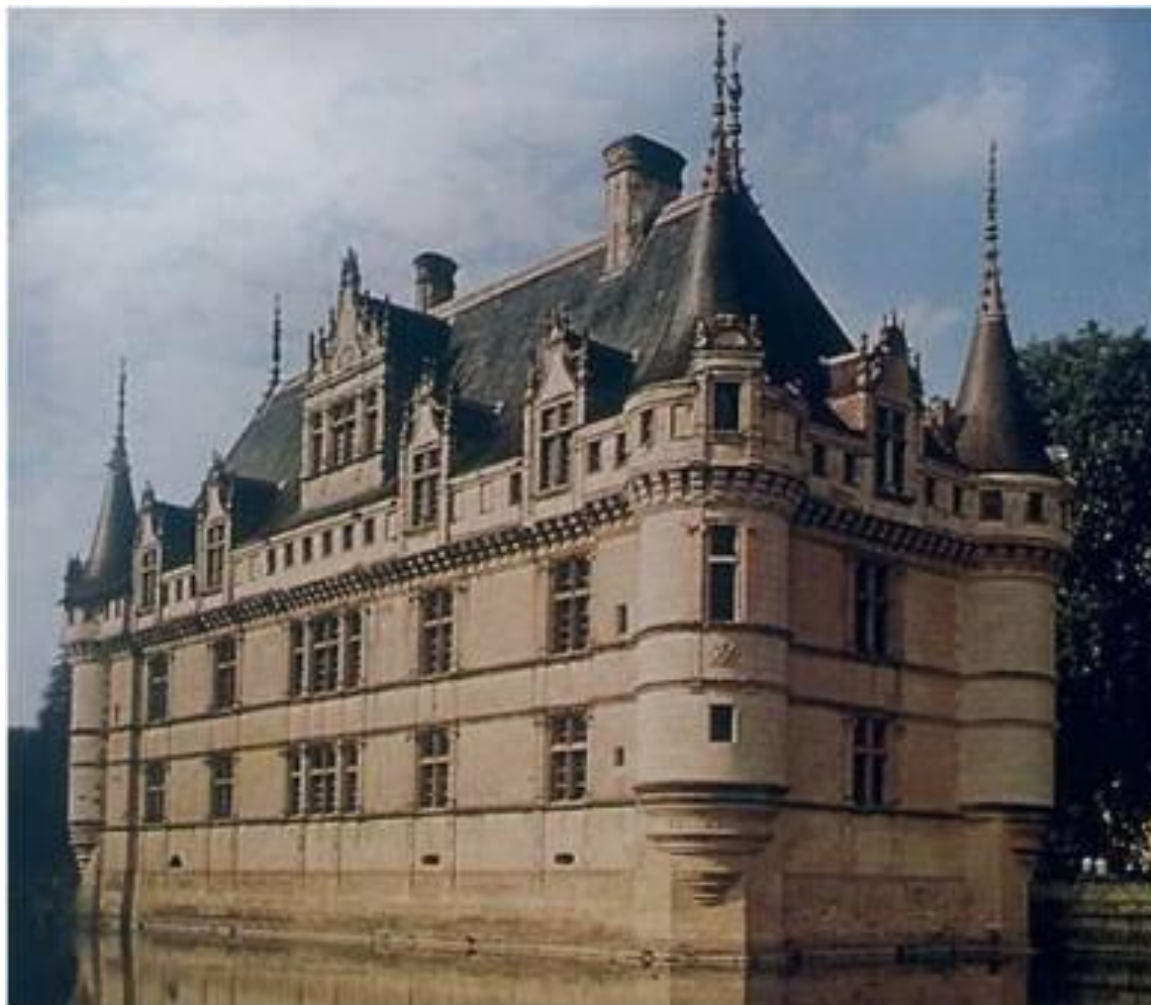
Замок Азе-ле-Ридо в 16 в. Франция

Где располагались замки? Замок — укрепленное жилище феодала в средневековой Европе.