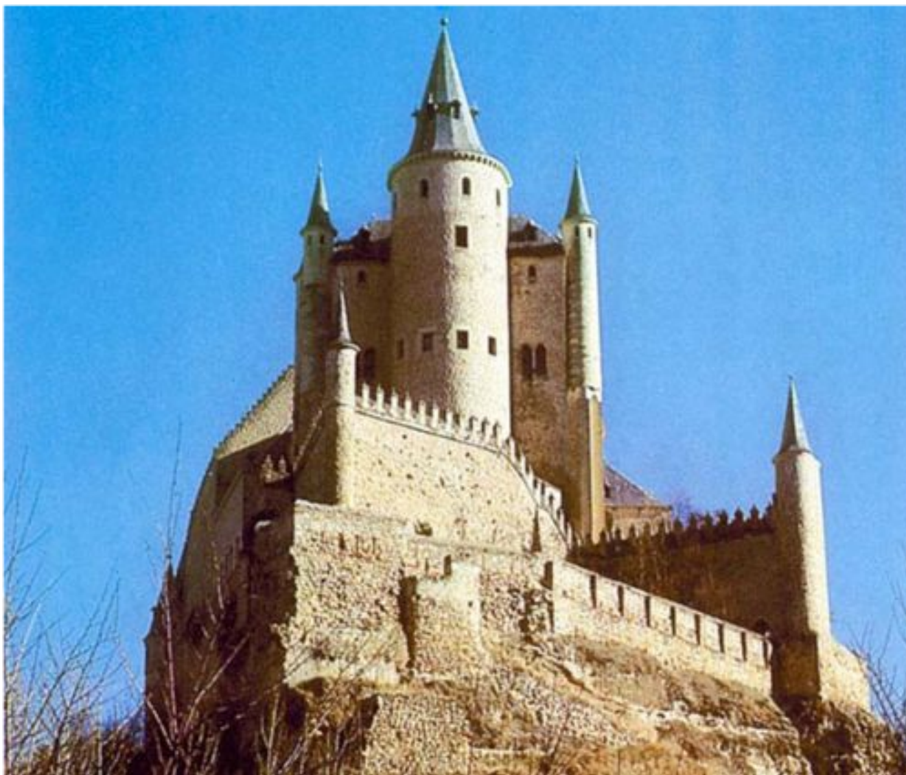
Замок Алькасар. Испания. 1110 – 1140 г