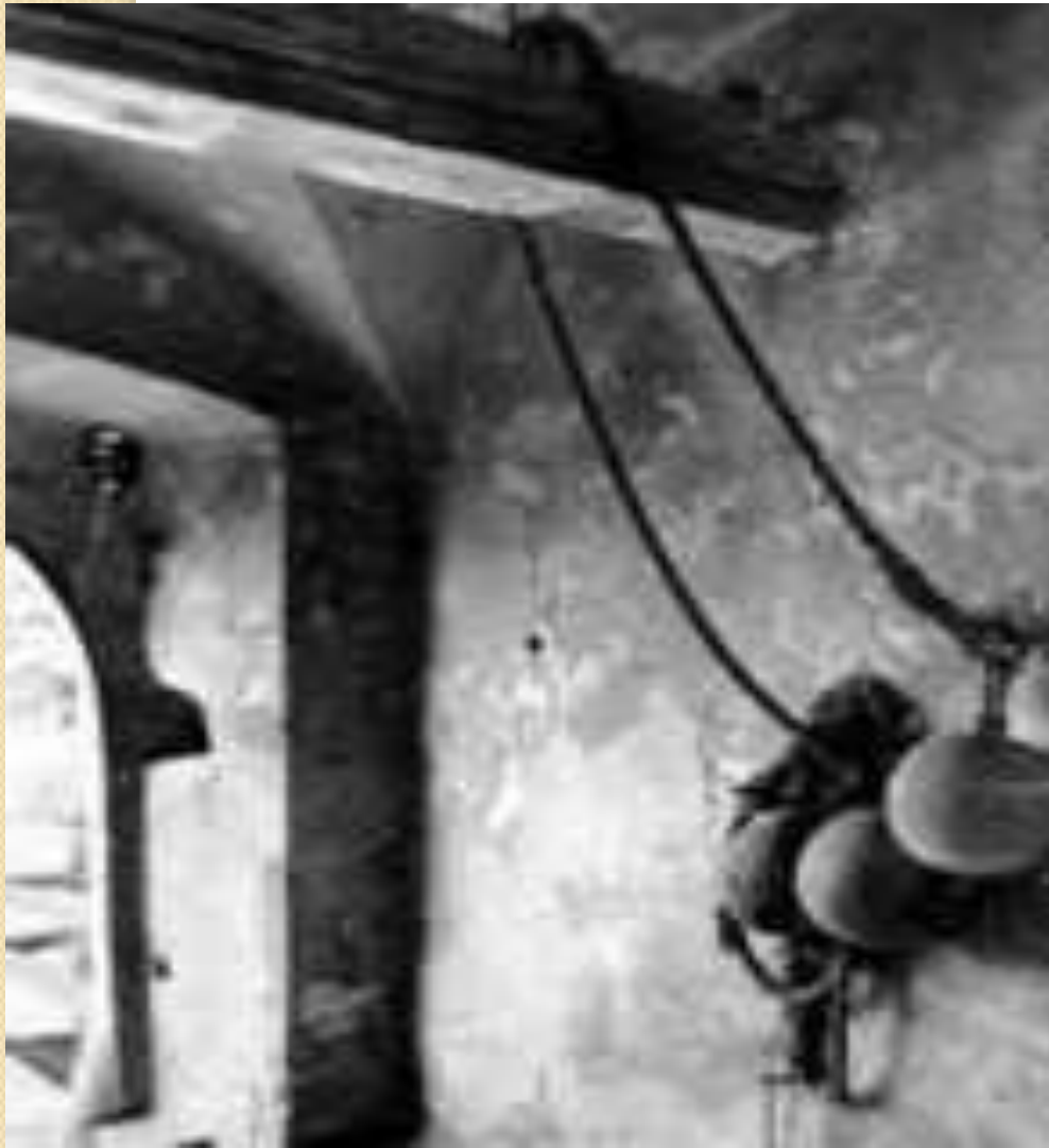
Противовесы на подъемнике ворот

От моста к подъемным машинам в стенные отверстия уходят канаты или цепи. Для облегчения работы людей, обслуживающих механизм моста, канаты иногда снабжались тяжелыми противовесами, берущими часть веса этой конструкции на себя.