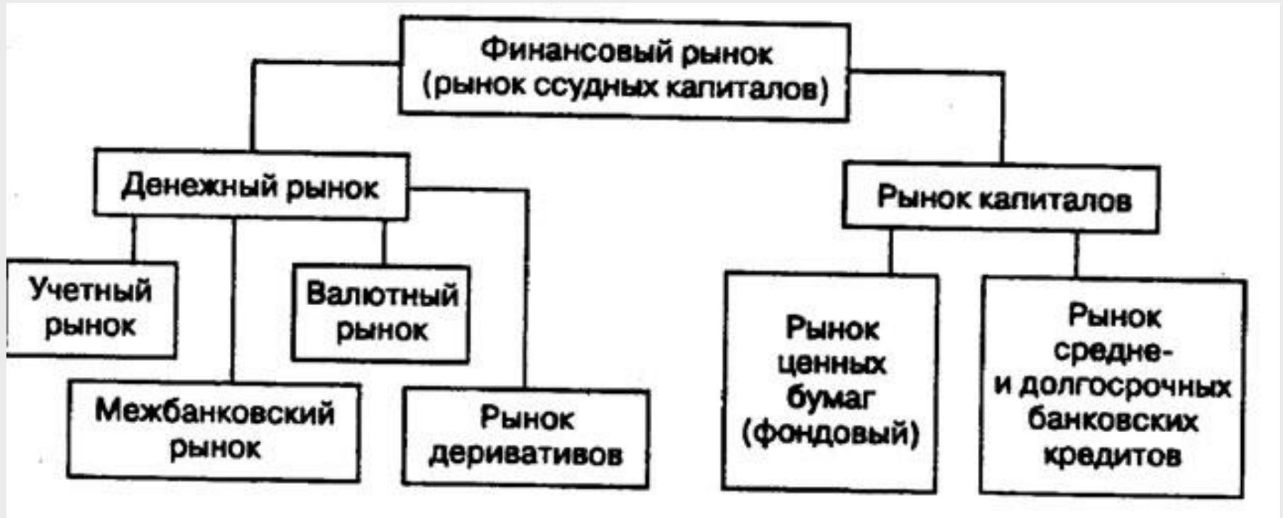
Рис.1 Структура финансового рынка