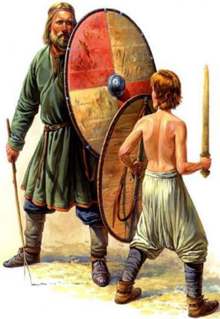
Обучение мальчика обращению с мечом и щитом