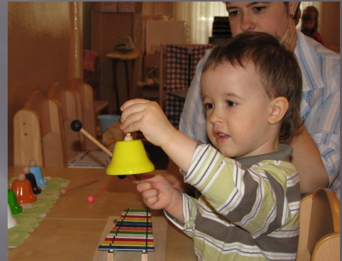
Игра на музыкальных инструментах