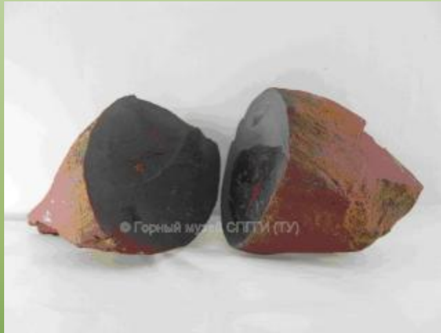
Вулканическая крученая бомба (в разрезе).