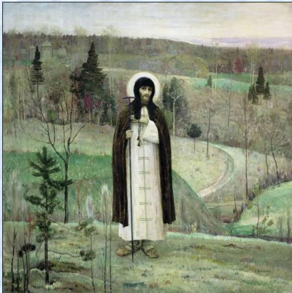
“Преподобный Сергий Радонежский” Михаил Нестеров

Сергий «тихими и кроткими словами» мог действовать на самые заgrубелые и ожесточённые сердца; очень часто примирял враждующих между собой князей, уговаривая их подчиняться великому князю московскому.