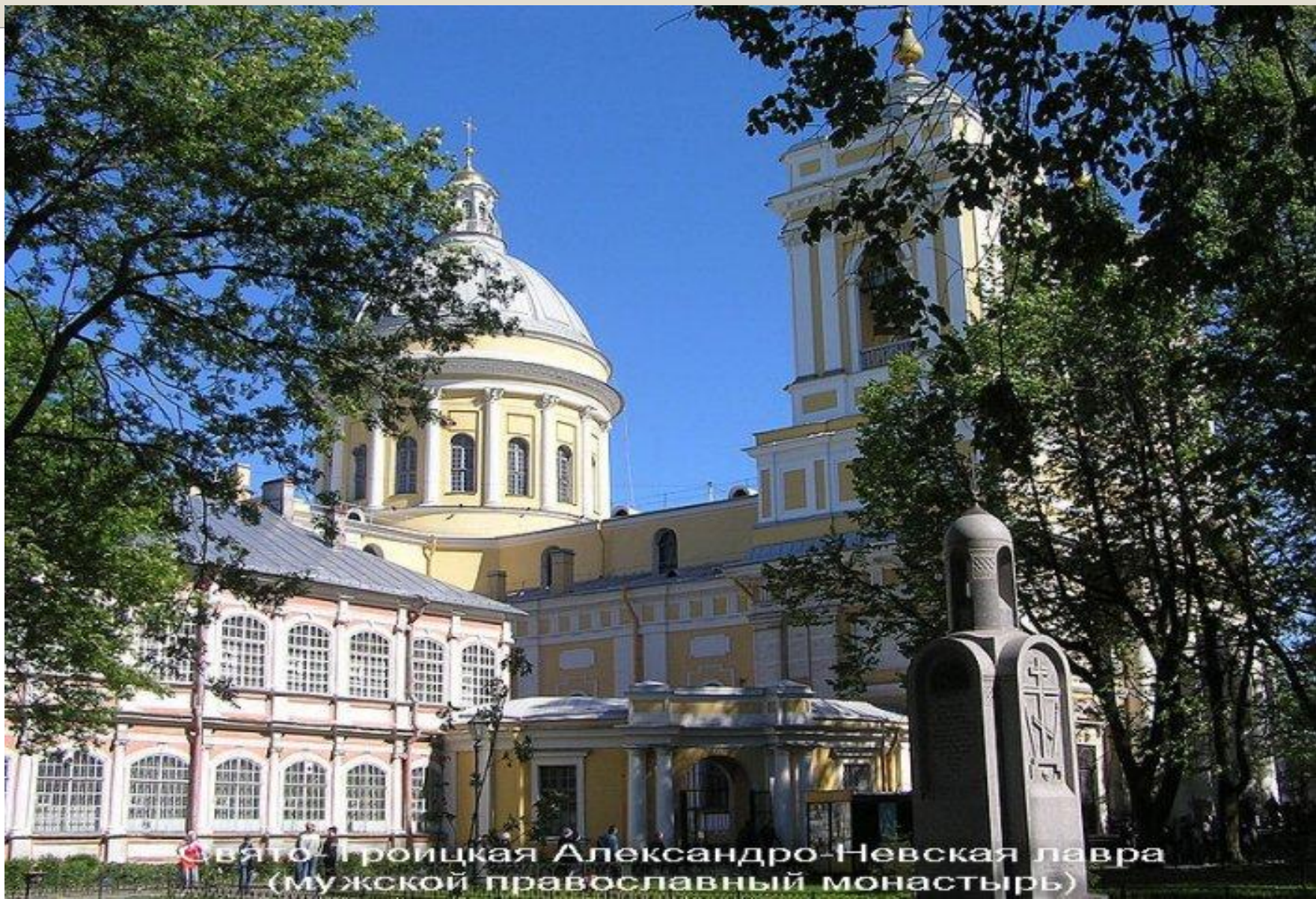
Свято-Троицкая Александро-Невская лавра (мужской православный монастырь)