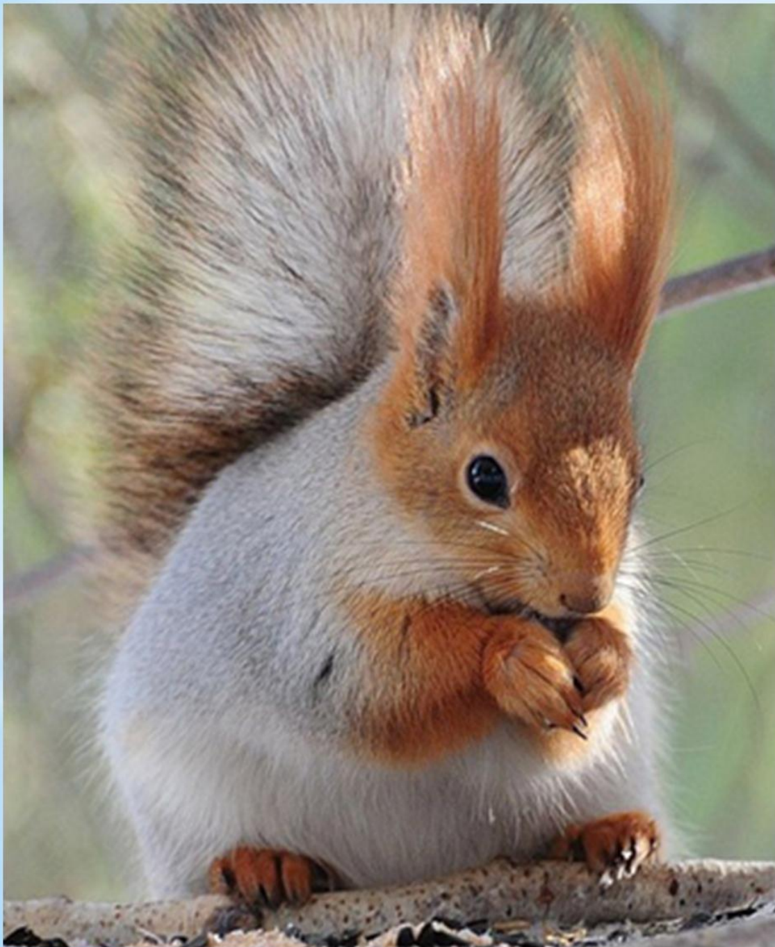
Белка - телеутка