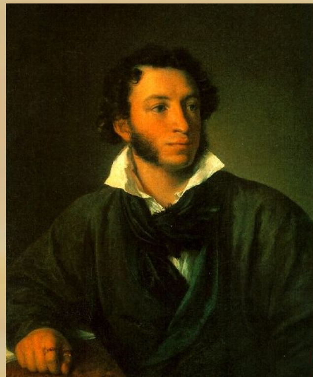
Портрет маслом В. Тропинина, 1827 г.