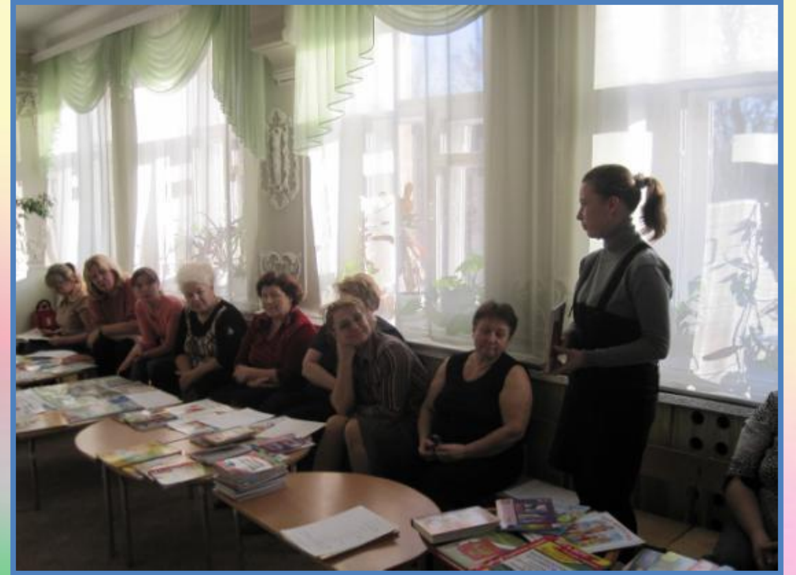
Выступления на педагогических советах