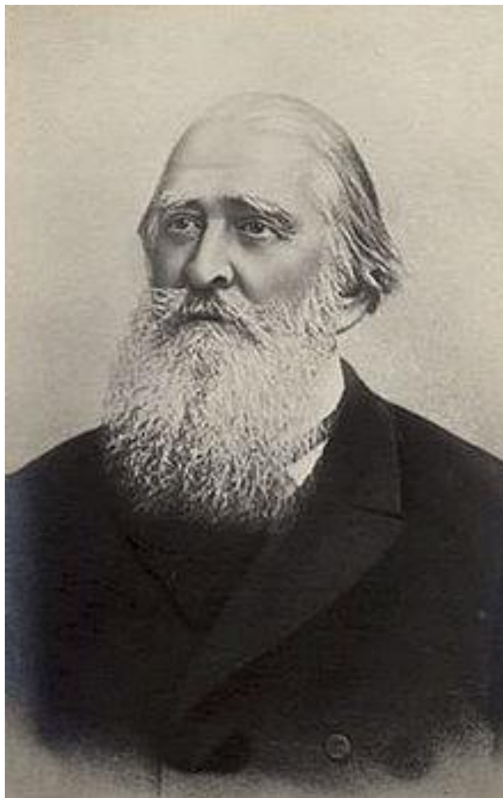
Алексей Николаевич Плещеев (1825-1893)