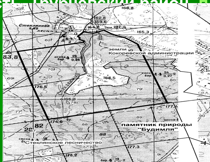
Карта 2. Территория и граница памятника природы "Будимля".