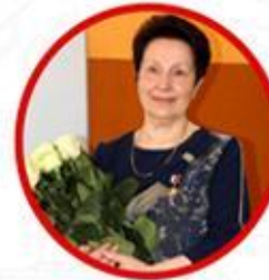
ГРОМОВА ГАЛИНА ГЕРАСИМОВНА заслуженный учитель РФ, Герой труда РФ