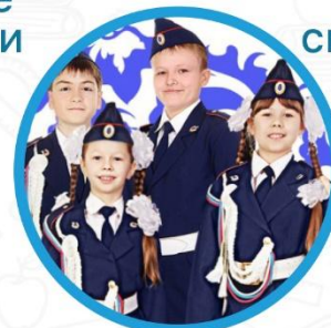
Юные инспектора дорожного движения