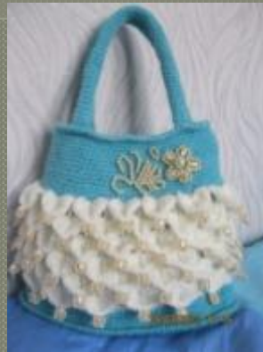
Сумочка в подарок