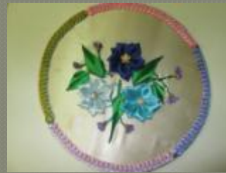
Картина из атласных лент