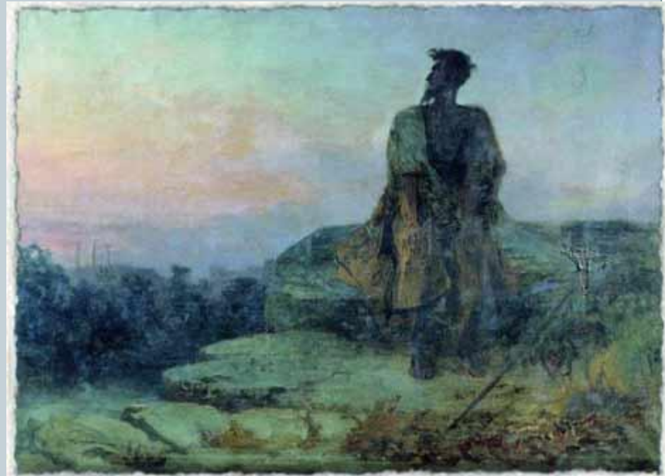
1874 г. Иуда. Фёдор Андреевич Бронников.