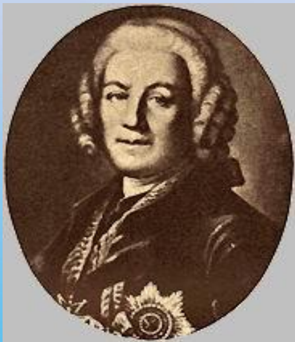
Канцлер А.П. Бестужев