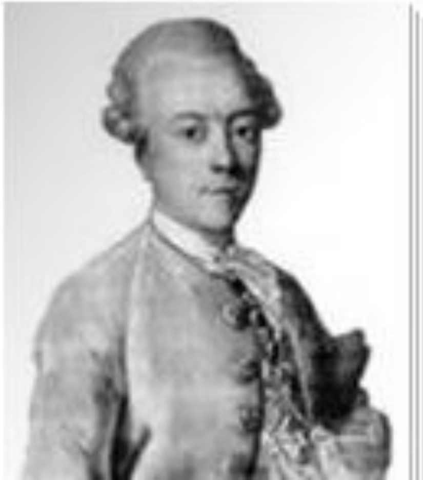
Этьенн Безу (1730 - 1783)