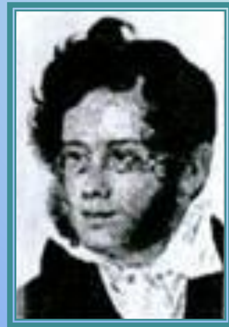
Петр Андреевич Вяземский