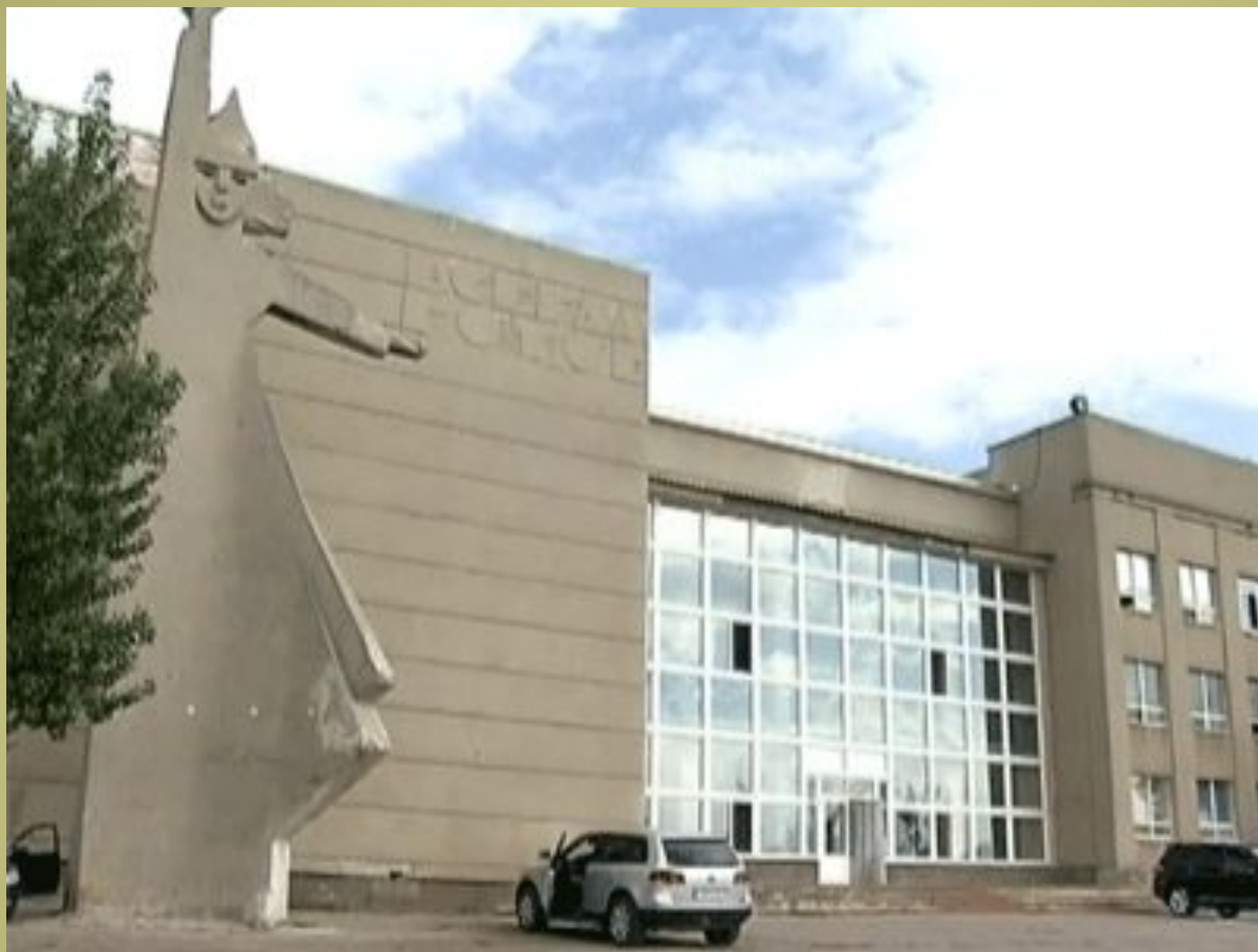
Центр детского творчества