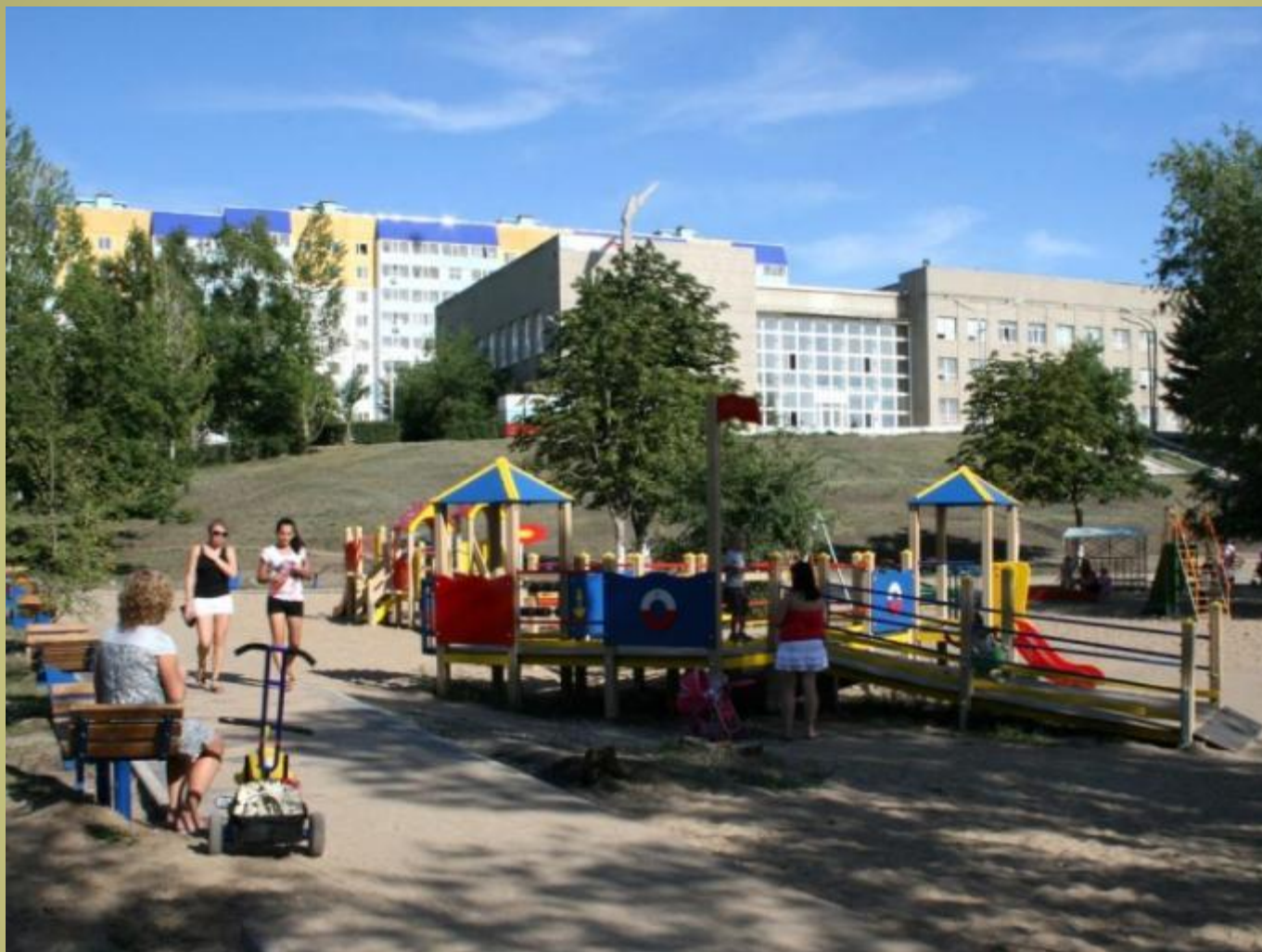
Парк «Территория Детства»