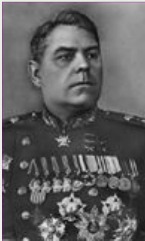
Василевский А.М., представитель Ставки.