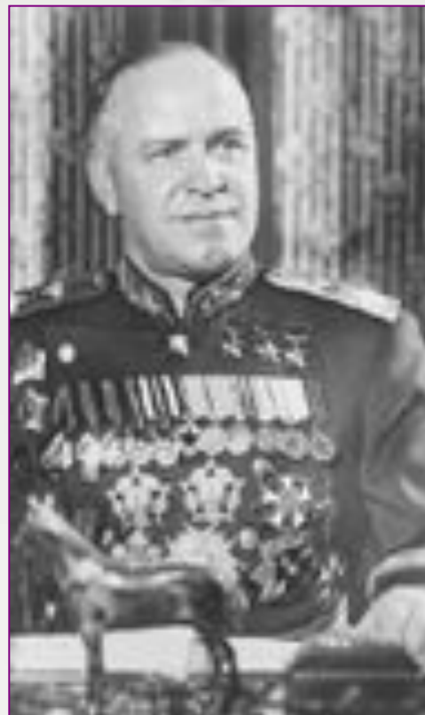
Жуков Г.К., представитель Ставки.