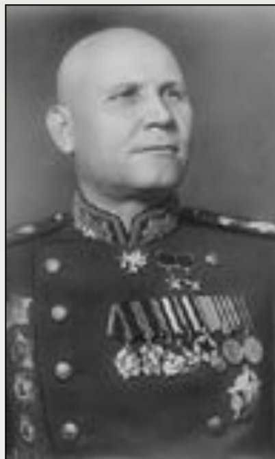
Конев И. С., командующий Степным фронтом