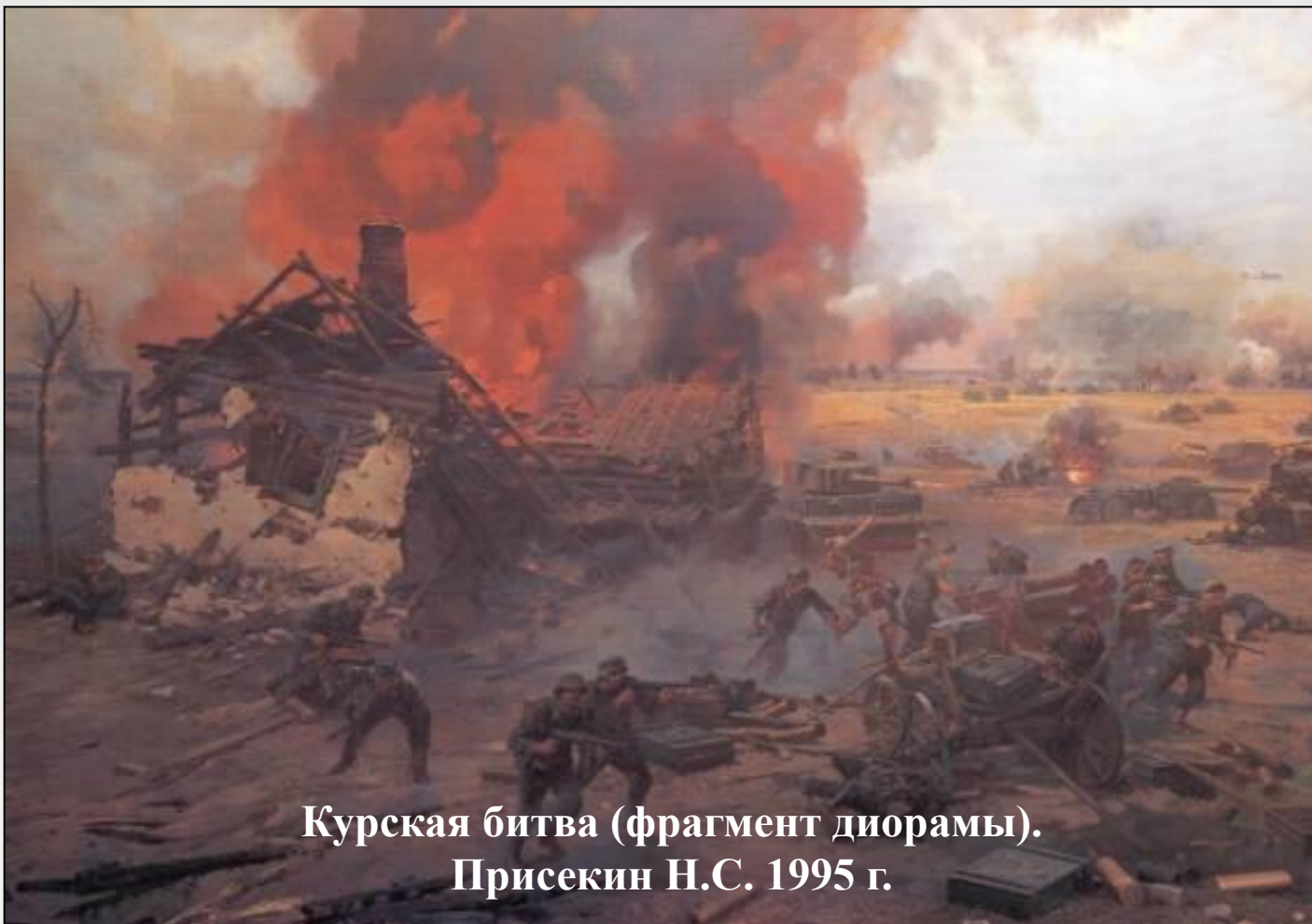
Курская битва (фрагмент диорамы). Присекин Н.С. 1995 г.