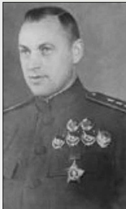
Рокоссовский К.К., командующий Центральным фронтом