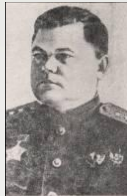
Н.Ф. Ватутин, командующий Воронежским фронтом