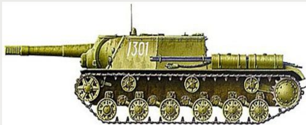
СУ – 152