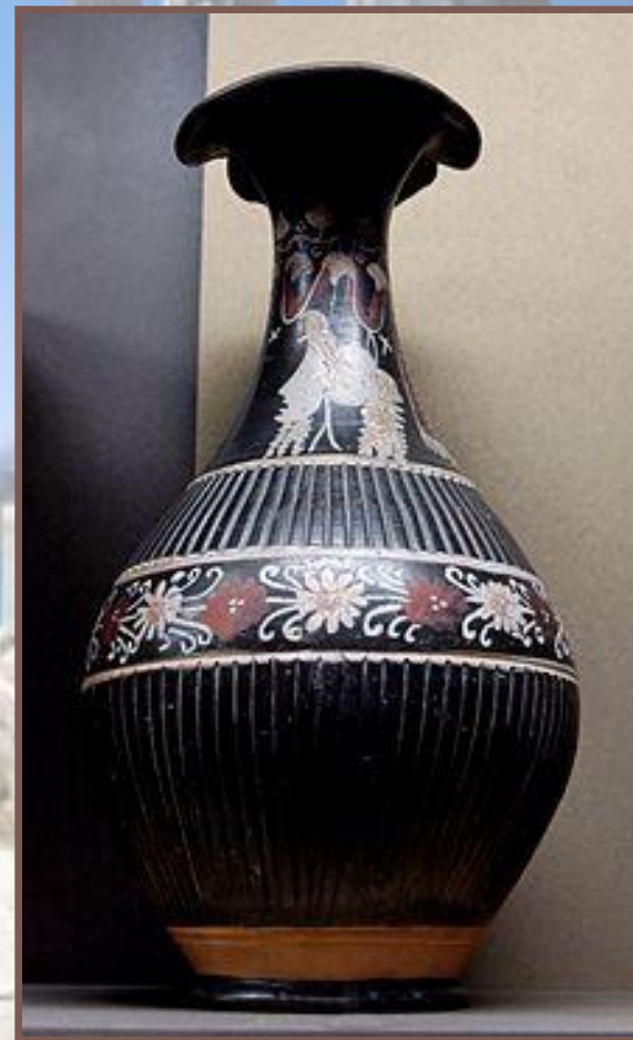
Ойнохойя-гнафия. 300—290 гг. до н. э.

Вазы-гнафии, названные по месту первого их обнаружения в Гнафии (Апулия), появились в 370—360 гг. до н. э. Эти вазы родом из нижней Италии получили широкое распространение в греческих метрополиях и за их пределами. В росписи гнафий по чёрному лаковому фону использовались белый, жёлтый, оранжевый, красный, коричневый, зелёный и другие цвета. На вазах встречаются символы счастья, культовые изображения и растительные мотивы.