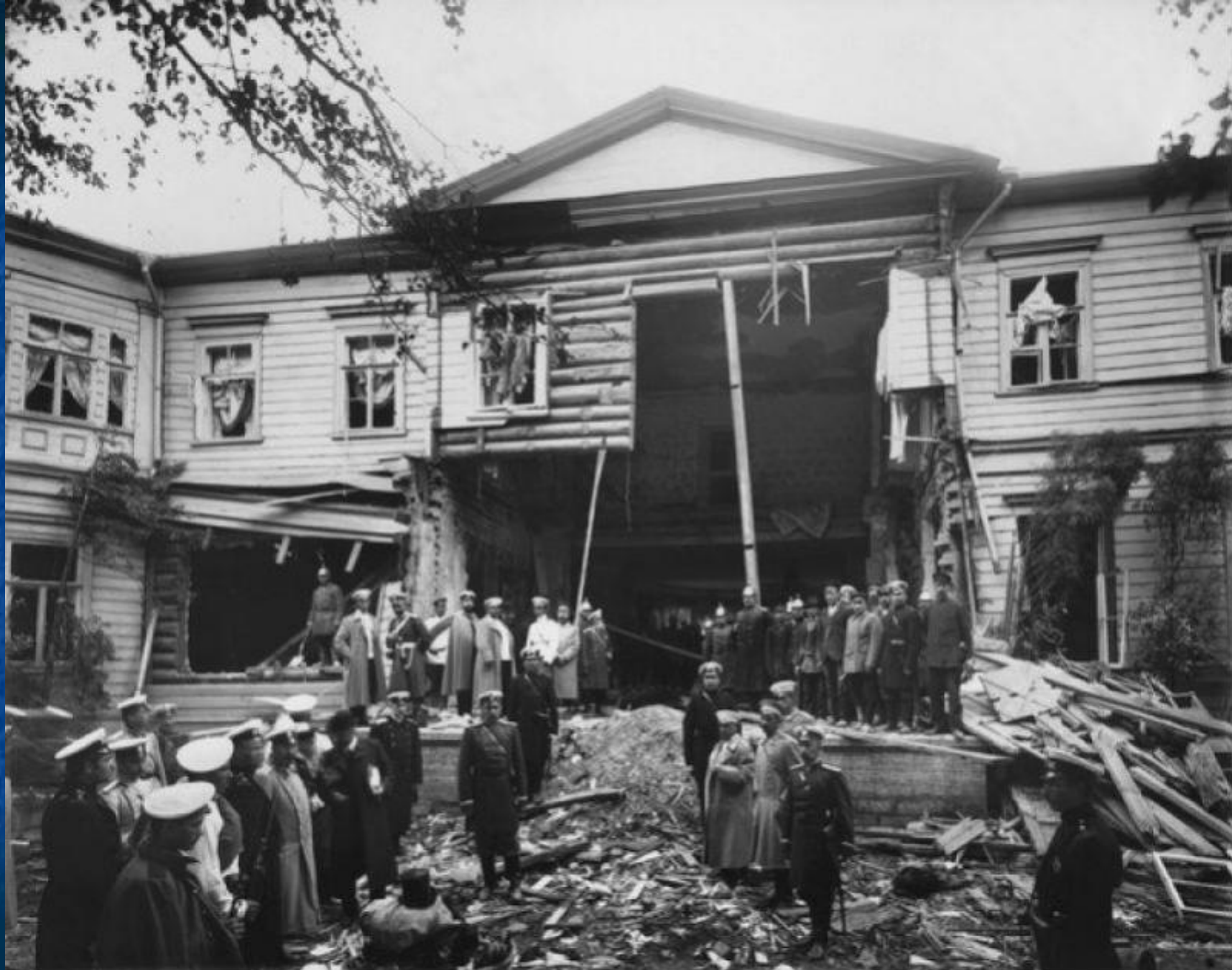
Дача П.А.Столыпина после взрыва / [12 августа 1906 г.] г. Санкт-Петербург