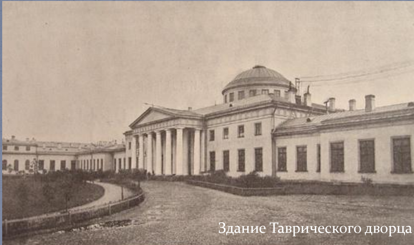
Здание Таврического дворца

(I Государственная Дума, апрель 1906 г.)