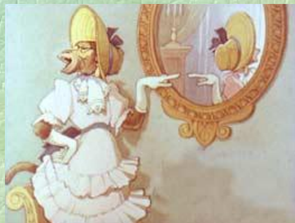
Зеркало и Обезьяна