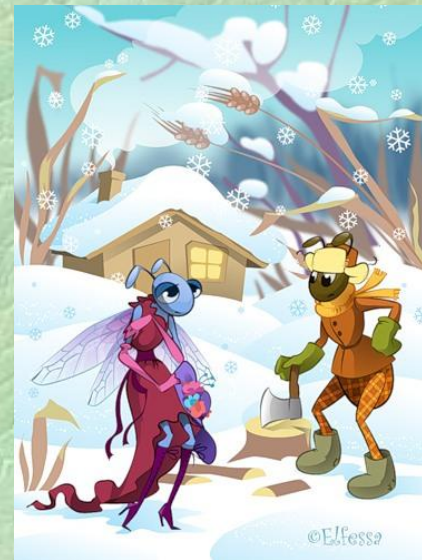
Стрекоза и Муравей