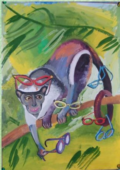
Мартышка и Очки