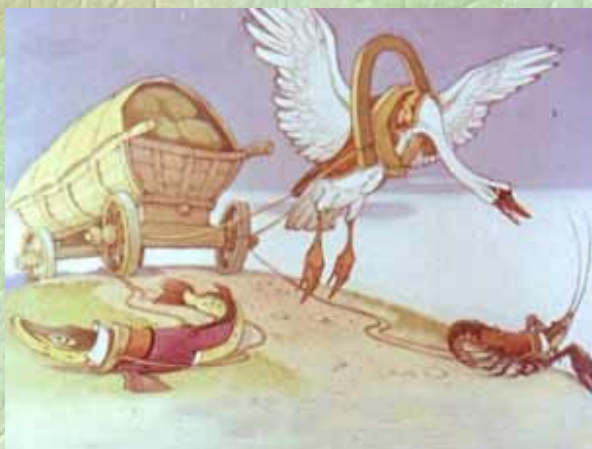
Лебедь, Щука и Рак