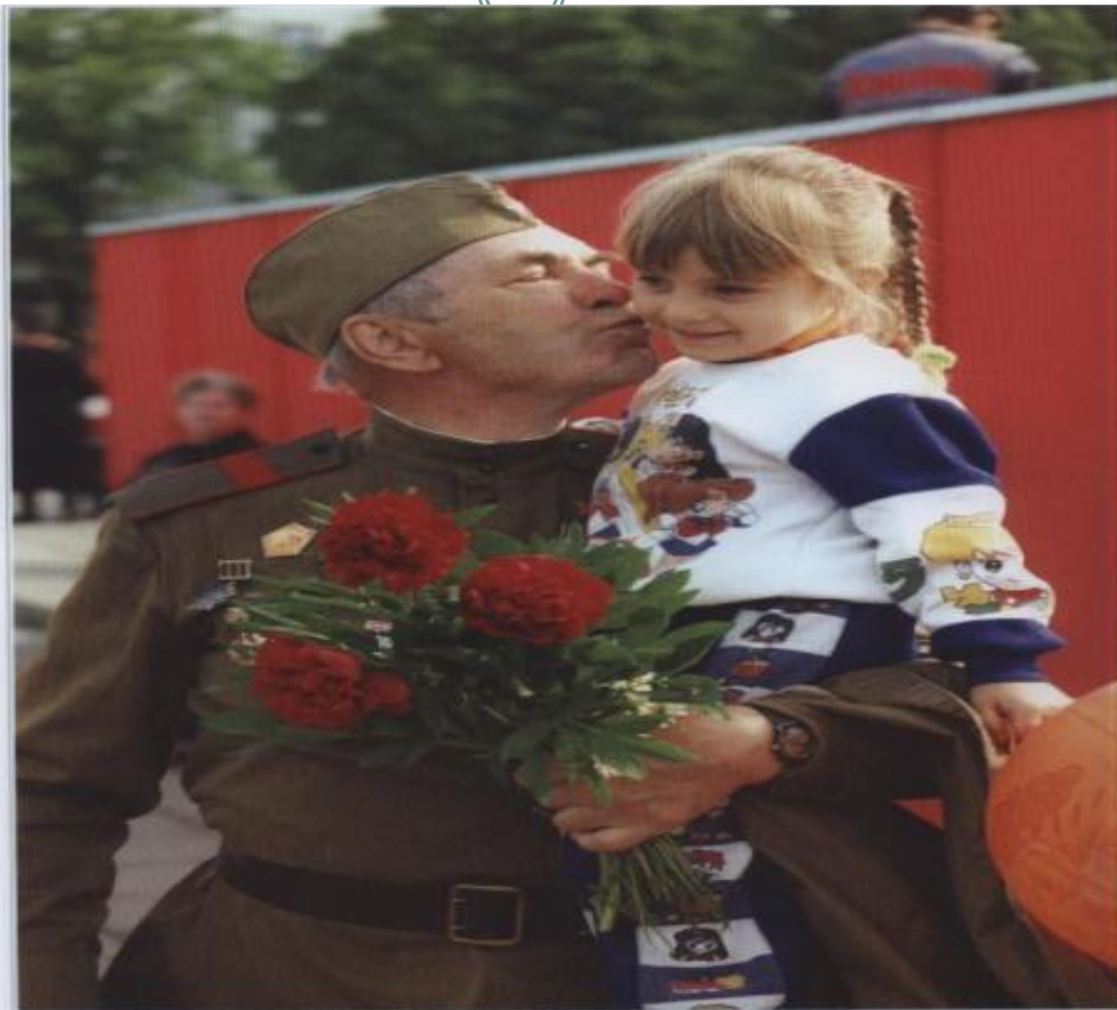
Солдат Победы.