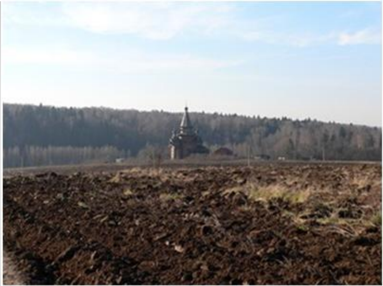
Храм преподобного Сергия Радонежского