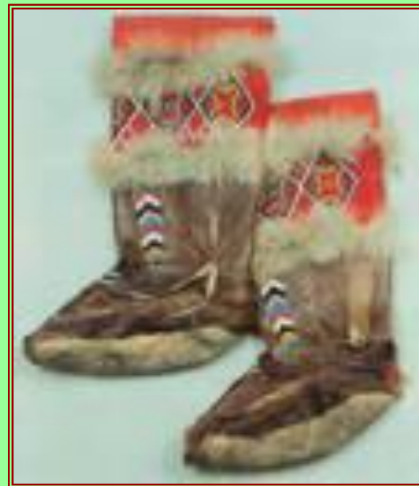
Унты - обувь