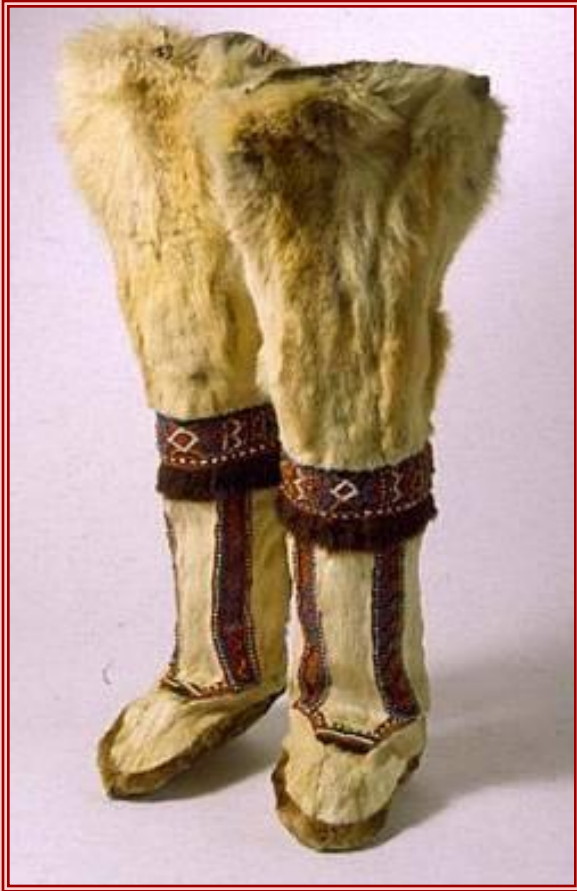
Мужская меховая обувь долган