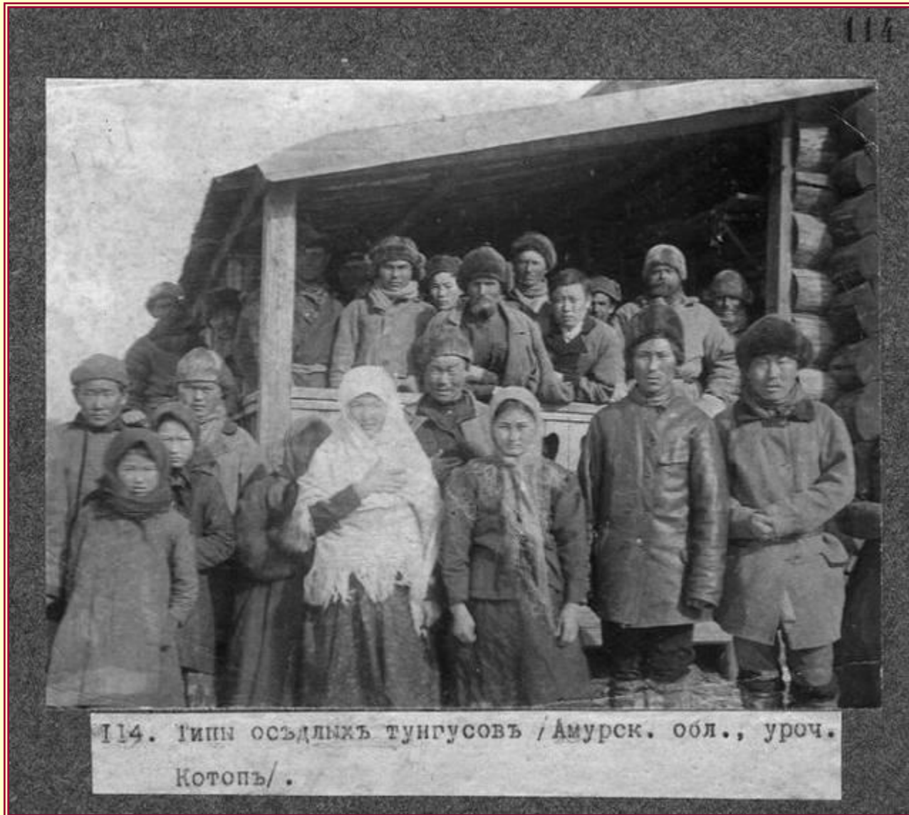
114. Типы осѣдлыхъ тунгусовъ / Амурск. обл., уроч. Котопъ/.

Эвѣнки (муж. род — эвенк, жен. род — эвенкийка, др. название — тунгусы, самоназвание: эвэнкил) — сибирский малочисленный коренной народ, родственный маньчжурам и говорящий на языке тунгусо-маньчжурской группы. Живут в России, Китае и Монголии.