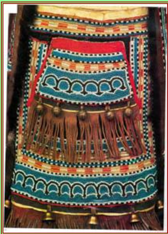
Фрагмент нагрудника мужского костюма якут.