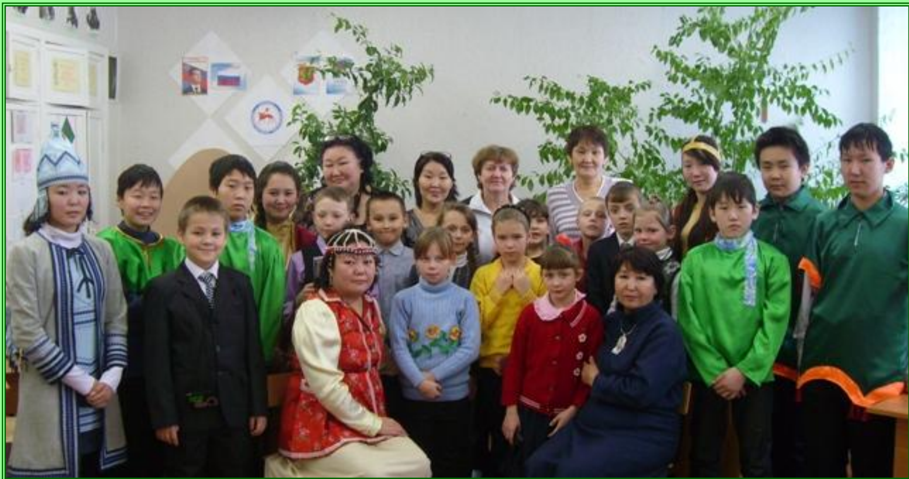
Мой класс .Встреча с коренными жителями (эвенами) в нашей школе. Гости из Хатыстыря.