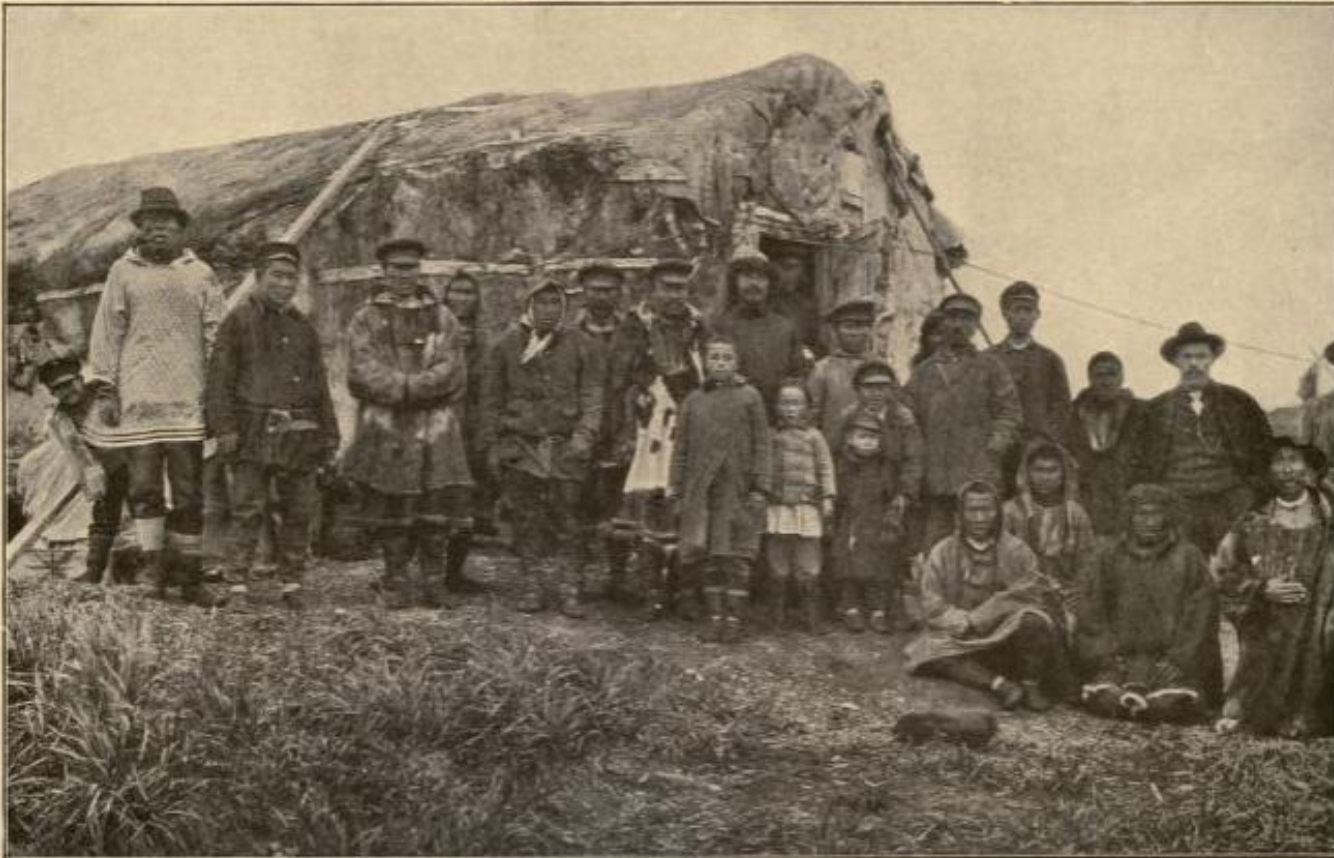
YOUNG AND OLD IN ANADYR.

Название народа от самоназвания тундровых чукчей «чаучу», «чавчавыт» – богатый оленями.