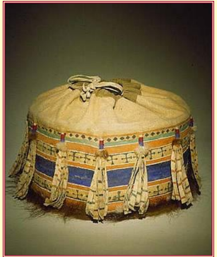
Короб для домашней утвари.