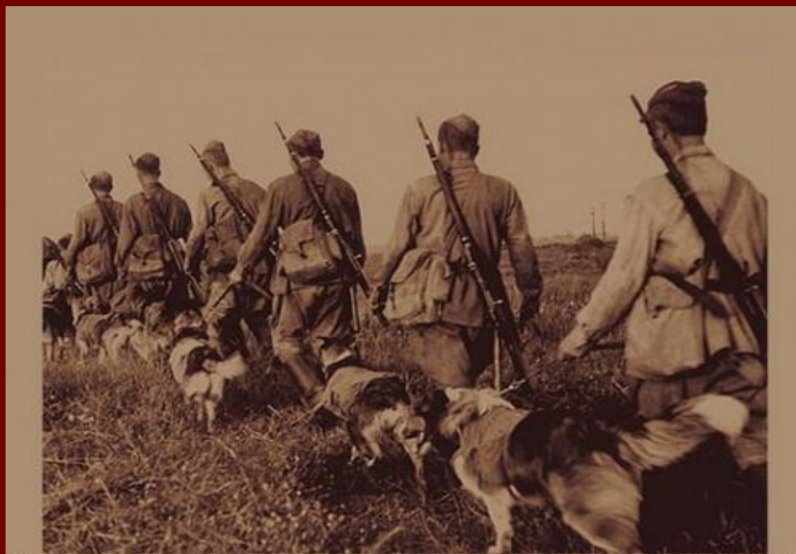
Фото 1942 года . Фронтные собаки -Бойцы со своими проводниками.

По всем военным дорогам прошли более 68 тысяч собак, которые внесли неоценимый вклад в дело Великой Победы над врагом.