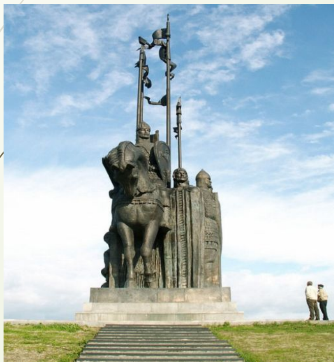
Памятник Александру Невскому на горе Соколиха (1993 г.; ск. Козловский И. И.; арх. Бутенко П. С.)