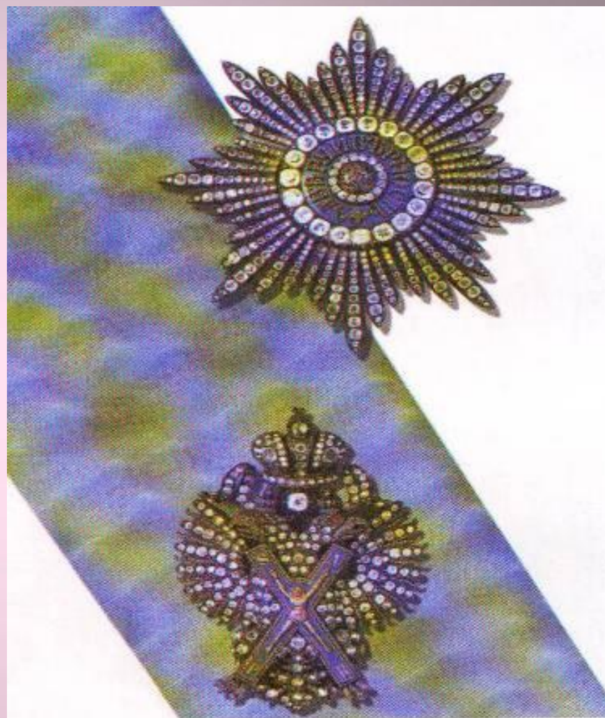
Орден Святого апостола Андрея Первозванного: знак, лента, звезда