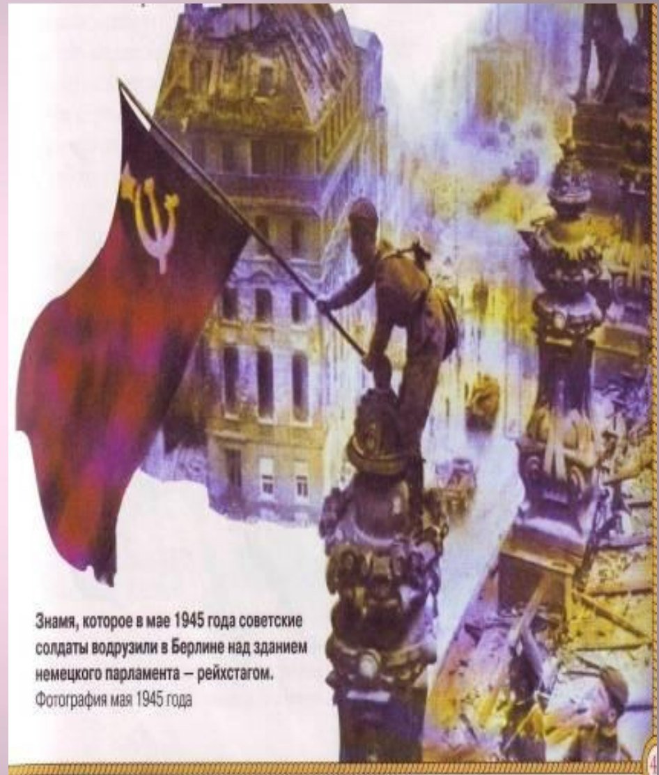
Знамя, которое в мае 1945 года советские солдаты водрузили в Берлине над зданием немецкого парламента – рейхстагом. Фотография мая 1945 года