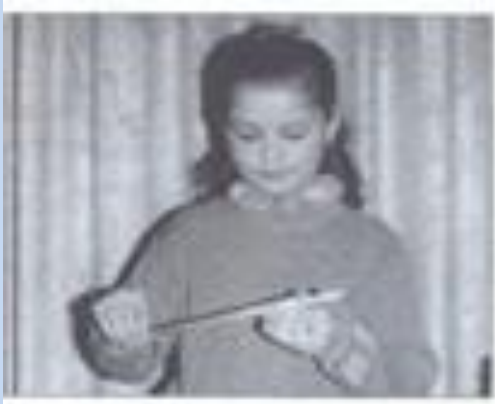
4 Скручивание пуховой пряжи и шёлка