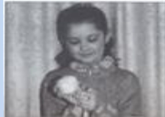
5 Сматывание нитки