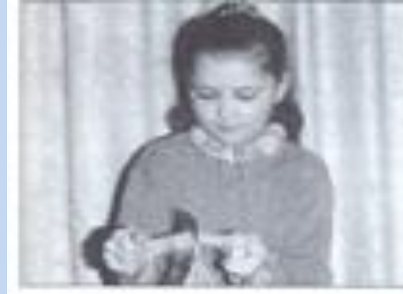
2 Чесание пуха