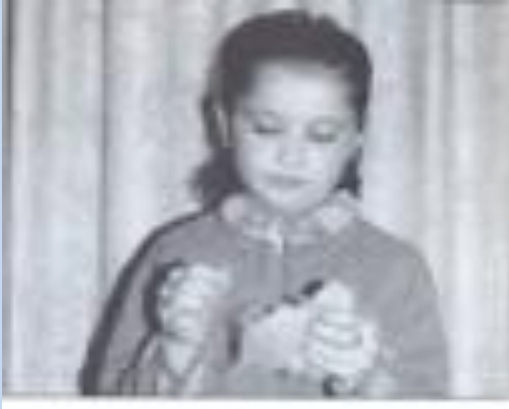
1 Выдёргивание остевых волосков