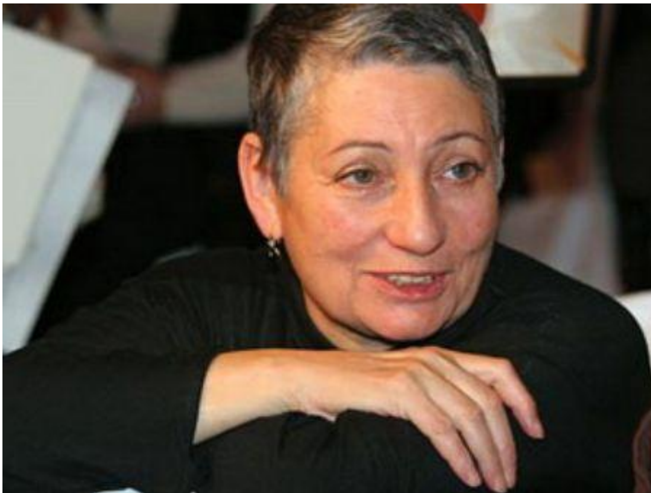
Людмила Евгеньевна Улицкая