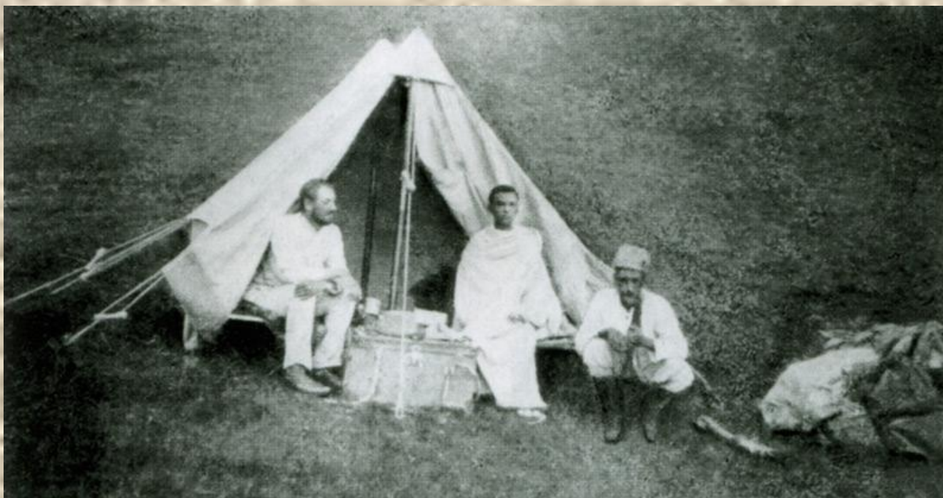
Н. Гумилев в экспедиции в Африке.

Он написал «Африканский дневник», где рассказывал о жизни местных племён, об их легендах и поверьях, о тех приключениях, которые ему довелось испытать во время путешествия.