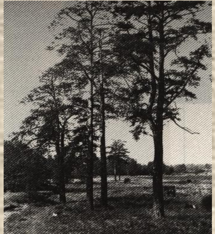
Место казни Гумилёва.

Гумилёв приближался к вершине своей поэтической славы, когда его жизнь трагически оборвалась. В августе 1921 года он был расстрелян по обвинению в контрреволюционном заговоре.