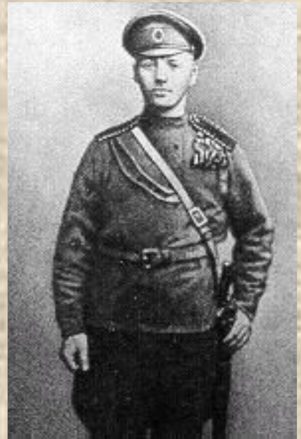
Н. Гумилёв 1914 год

Гумилев был единственным русским писателем, который пошел добровольцем на фронт. Как и ко всему, что делал, к своему участию в войне Гумилёв отнёсся крайне серьёзно. Тут же стал тренироваться, совершенствоваться в стрельбе, езде и фехтовании. Служил Гумилёв прилежно, отличался храбростью – о том говорит и быстрое его продвижение до прапорщика, и два Георгиевских креста – IV и III степеней, которые давались за исключительное мужество.