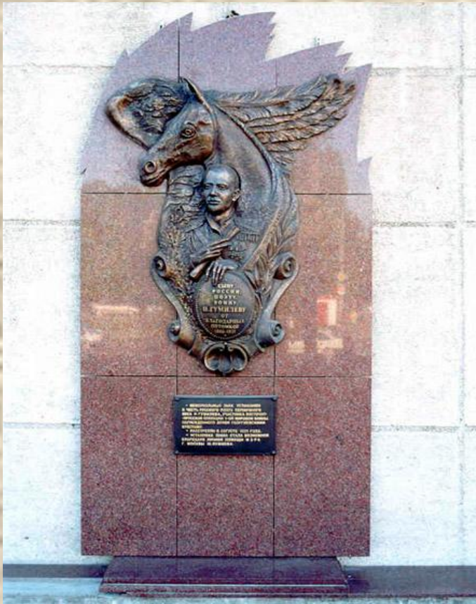
Мемориальная доска в Калининграде