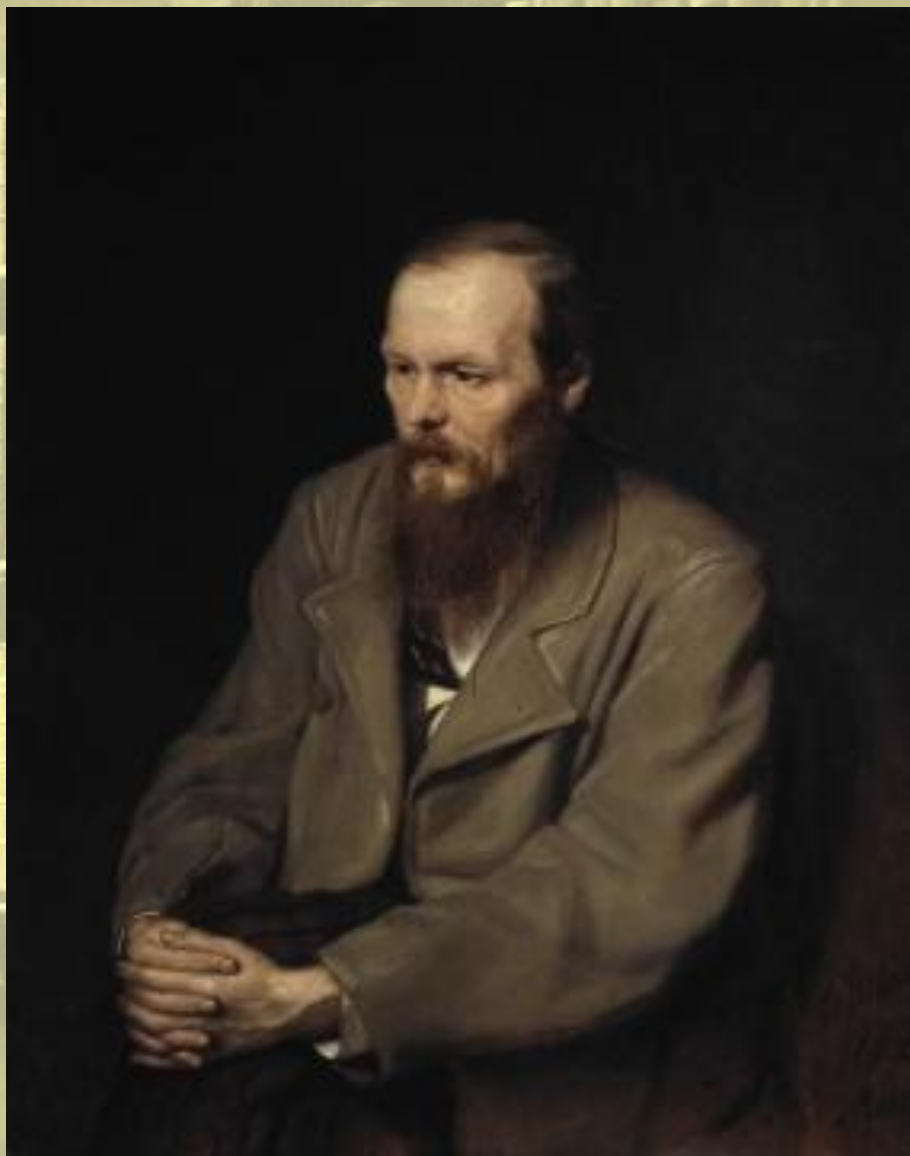
Василий Григорьевич Перов «Портрет Ф.М.Достоевского», 1872 г.